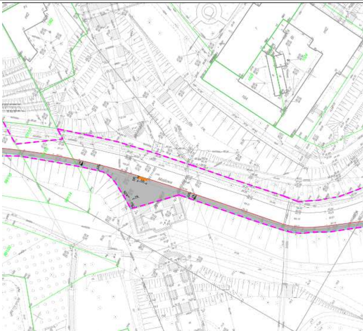
Plansza nr 3