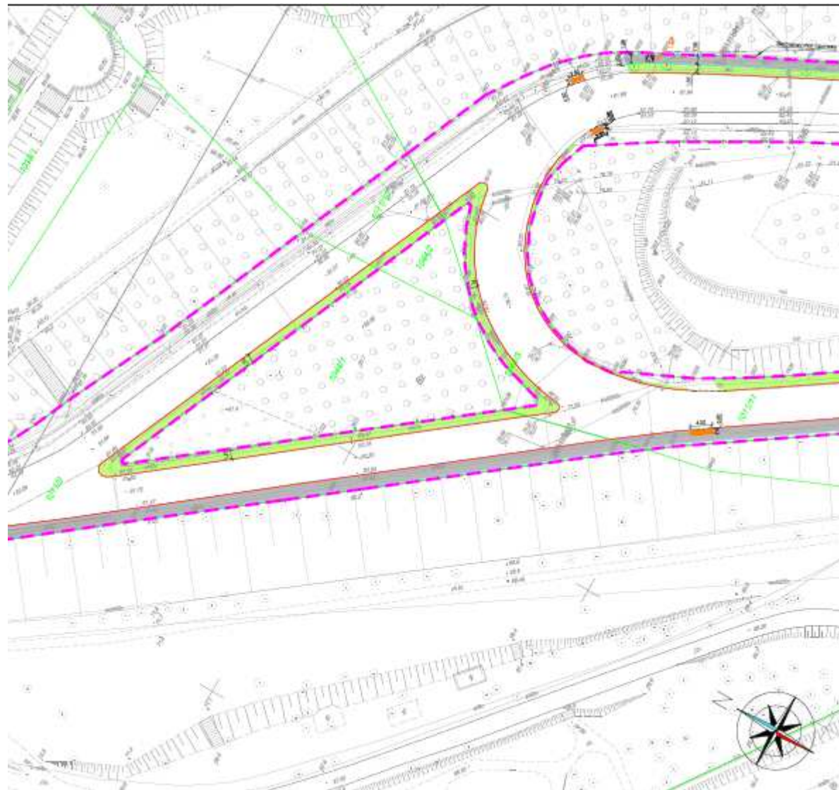
Plansza nr 4