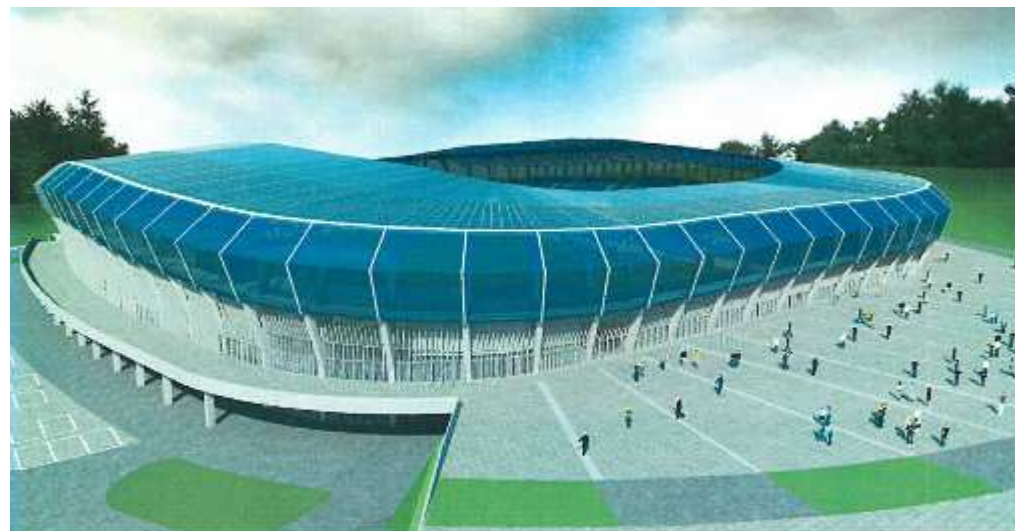
Plansza nr 3