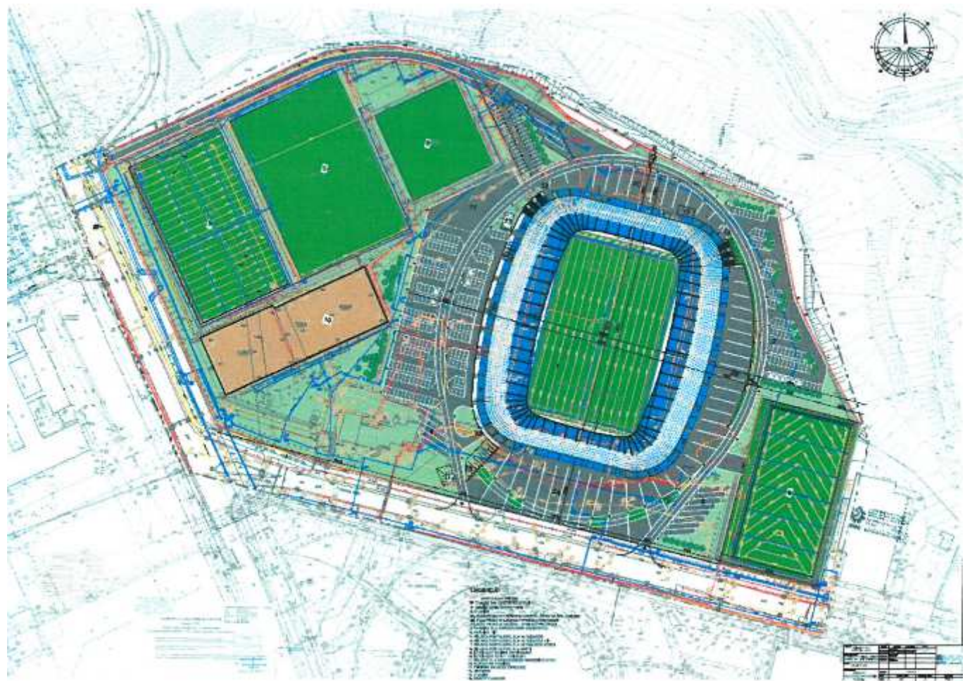
Plansza nr 1