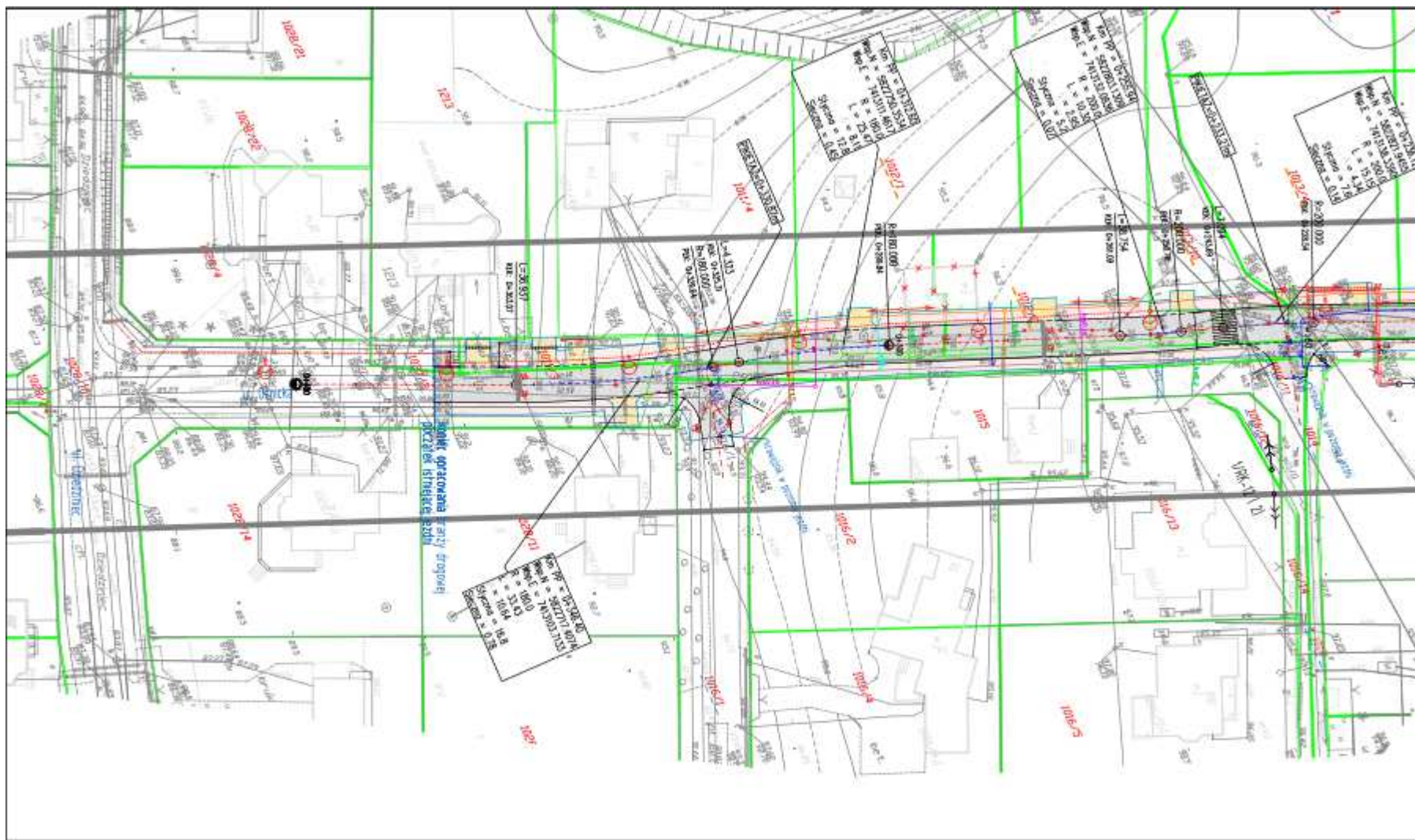
Plansza nr 1

Budowa ulicy Ośnickiej na odcinku od ulicy Dziejnic do ulicy Górnej w Płocku wraz z infrastrukturą techniczną