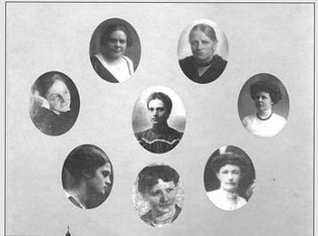
Fragm. okładki książki „Znakomite Płocczanki”