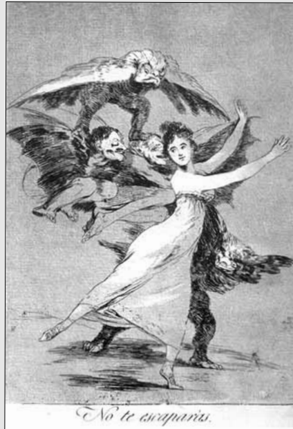
Francisco Goya, „Nie uciekniesz”

Wystawa niezwykłych rycin ze zbiorów TNP w Galerii Wisła to nietypowe przedsięwzięcie. Nie zdarzyło się bowiem dotychczas, by zbiory Towarzystwa prezentowane były w centrum handlowym. To niewątpliwie znak czasów. Zmienia się świat i społeczeństwo. Nowego znaczenia nabrało słowo „galeria”, niegdyś zarezerwowane dla sztuki. Obecnie nastąpiło przesunięcie jego znaczenia w związku z powstającymi „galeriami handlowymi”, będącymi odpowiedzią na potrzeby społeczeństwa, które coraz bardziej nastawione jest na konsumpcję. Okazuje się jednak, że słowem „galeria” połączyć można różne światy, czego dowodzić może zorganizowanie wspólnej wystawy przez płocką Galerię Wisła i Towarzystwo Naukowe Płockie. Inicjatywa ta to dobra forma upowszechniania kultury wśród mieszkańców miasta, to także okazja, by sztuką zainteresować nowe kręgi odbiorców. Dla Towarzystwa Naukowego