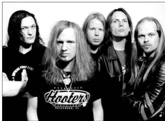
Niemiecki zespół Edguy zagra 11 września na płockiej plaży podczas „Rockowego Pożegnania Lata”