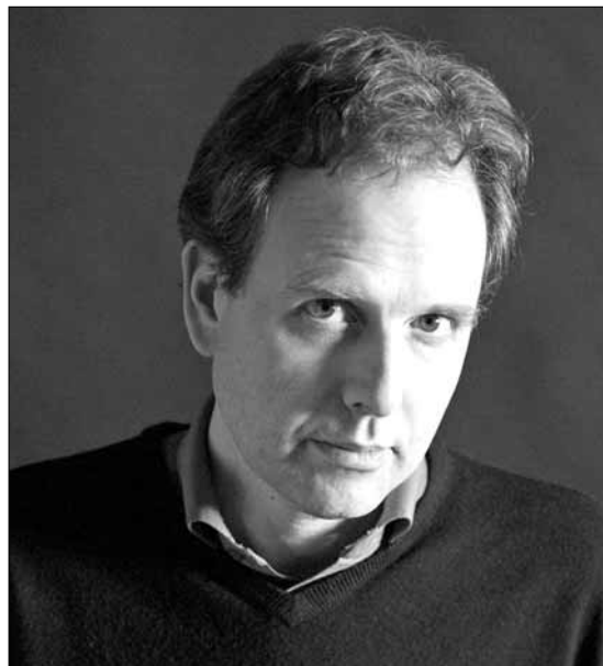
Kevin Kenner, pianista z USA wystąpi z Płocką Orkiestrą Symfoniczną 10 września o godz. 19

Płocka Galeria Sztuki (ul. Sienkiewicza 36), tel. 24/ 364 60 40, www.plockagaleria.com : w ramach Transgranicznego Festiwalu Sztuk im. St. Themersona wystawa „ W kręgu Themersonów ”; godz. 10-15 , wstęp wolny.