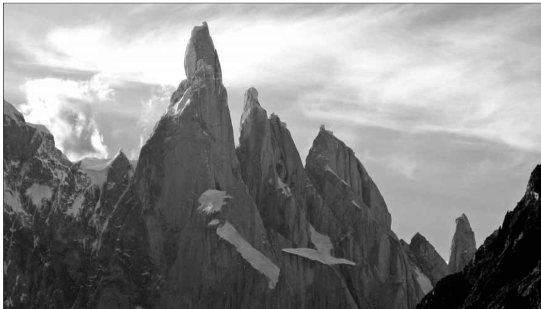
Cerro Torres i inne „cuda” Argentyny będzie można zobaczyć podczas pokazu slajdów w Domu Darmstadt 4 września o godz. 18