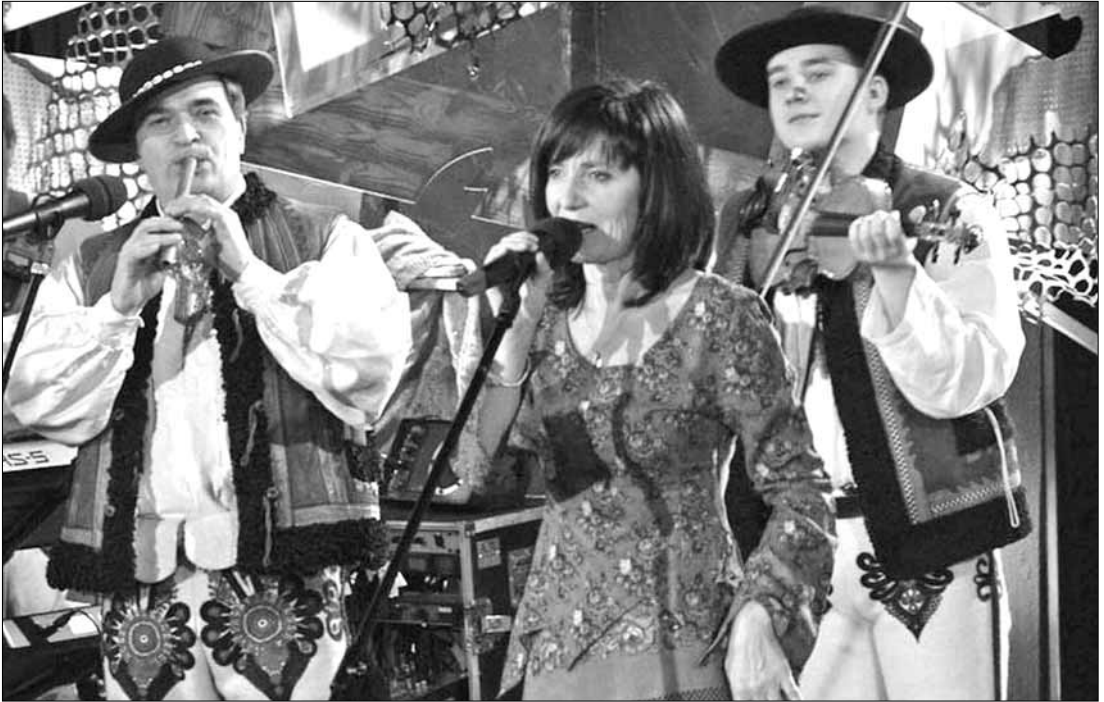
Zespół Krywań zagra na Rynku Starego Miasta podczas Międzynarodowego Dnia Kaszanki, 1 maja godz. 16