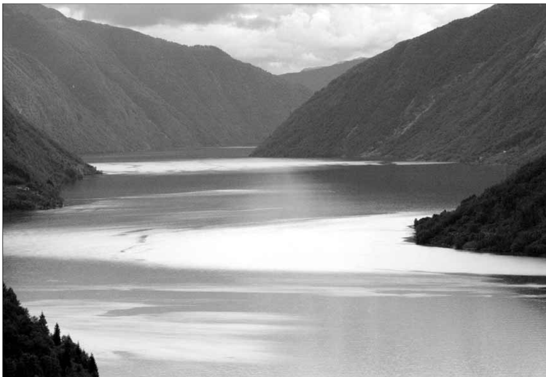
„W krainie wody, lodu i trolli – Norwegia”, pokaz slajdów w Domu Darmstadt, 11 maja godz. 18, wstęp wolny

Za zmiany w programie redakcja nie ponosi odpowiedzialności.