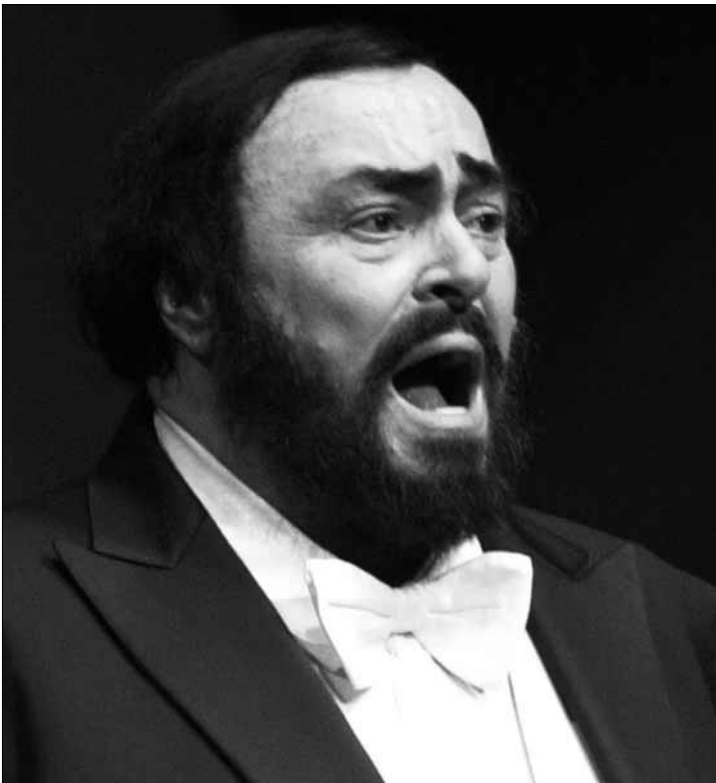
„Grandissmon” – film dokumentalny poświęcony Luciano Pavarottiemu w Domu Darmstadt 4 lutego

Klub Osiedla Kochanowskiego (ul. Obr. Westerplatte 6a), tel. 24/