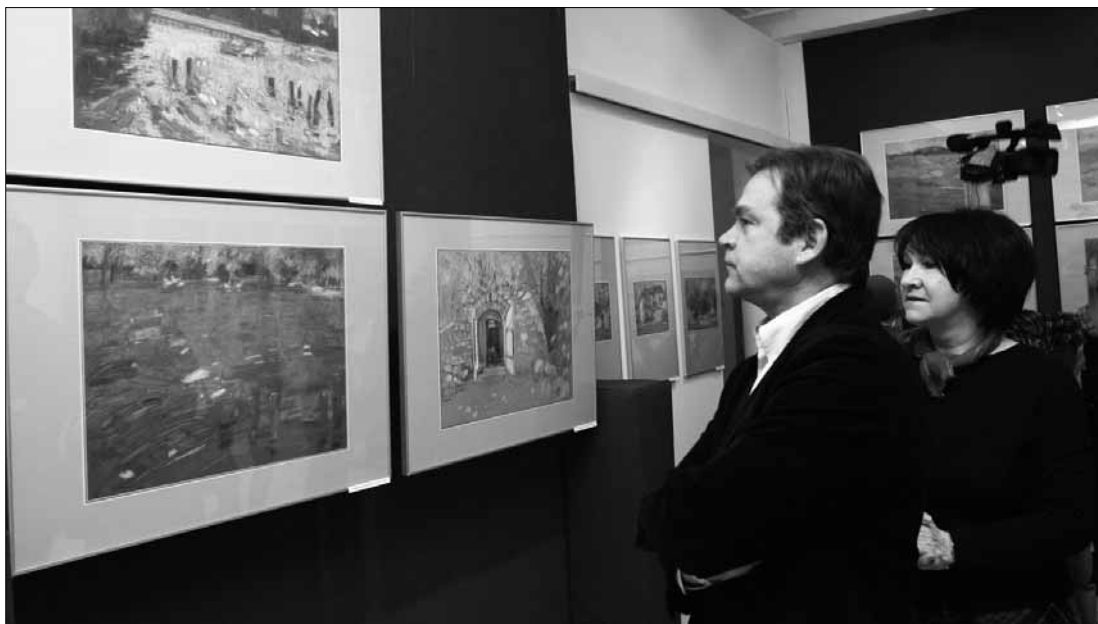
Pejzaże autorstwa pięciu artystek można oglądać w Płockiej Galerii Sztuki do 21 lutego

w kasie orkiestry (ul. Bielska 9/11, tel. 24/ 364 10 85), w sklepie muzycznym Harfa (ul. Kolegialna 1, tel. 24/ 262 34 57), możliwa rezerwacja internetowa.