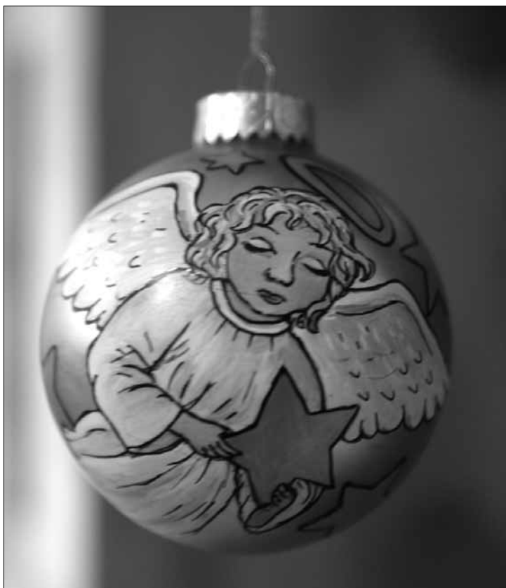
Ozdoby świąteczne w PGS do 10 stycznia

Biblioteka dla Dzieci im W. Chotomskiej (ul. Sienkiewicza 2), tel. 24/ 262 27 69: „ Kiedy zabronić, kiedy pozwolić. Jak sobie radzić z dziecięcymi humorkami ” – spotkanie dla rodziców zainteresowanych aktywnym wspieraniem rozwoju dzieci, prowadzone przez specjalistów z Poradni Psychologiczno-Pedagogicznej nr 2 – Ma-