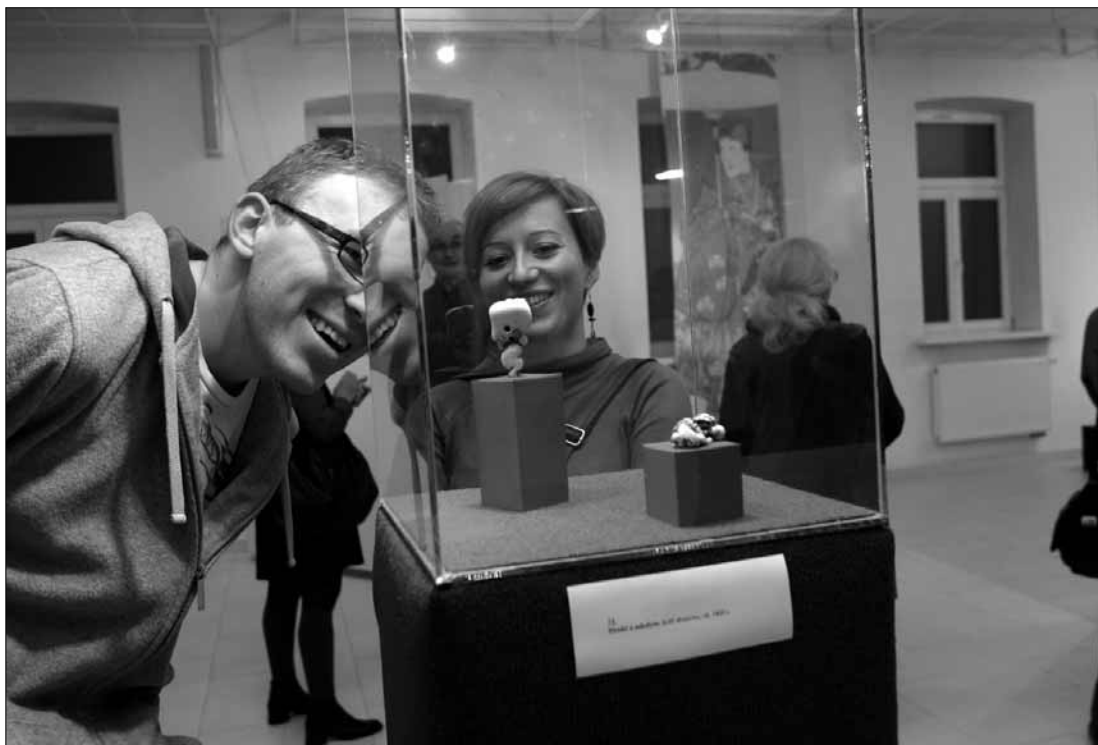
„Sztukę dawnej Japonii” pokazuje Płocka Galeria Sztuki