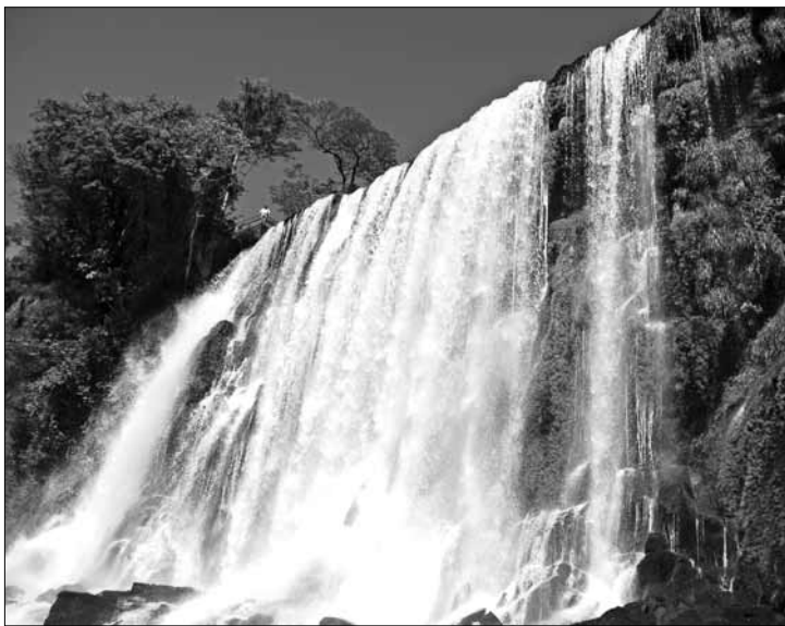
Z Klubem „Podróże” zwiedzaj Argentynę 11 stycznia

Płocki Ośrodek Kultury i Sztuki (Bazylika Katedralna, ul. Mostowa 2), tel. 24/ 367 19 20, www.pokis.pl: w ramach „Płockiego Kolę-