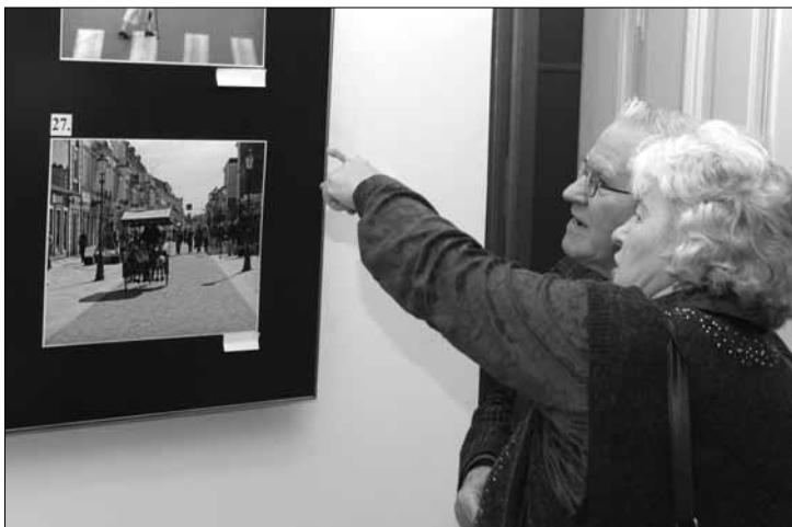
Wystawa „ Mój Płock ” w Książnicy Płockiej od 21 stycznia

Filia biblioteczna nr 5 (ul. Tumska 11), tel. 24/ 262 32 55, www.bibl.plock.pl: wystawa fotograficzna „ Nepal ” Arkadiusza