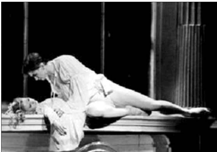
31 stycznia PTTK organizuje wyjazd do Warszawy na balet „Romeo i Julia”

Muzeum Wsi Mazowieckiej (ul. Narutowicza 64, Sierpc): „ Boże Narodzenie na Mazowszu ” – wystawa poświęcona mazowieckim tradycjom bożonarodzeniowym. Wystawa czynna od 13 stycznia do 28 lutego .