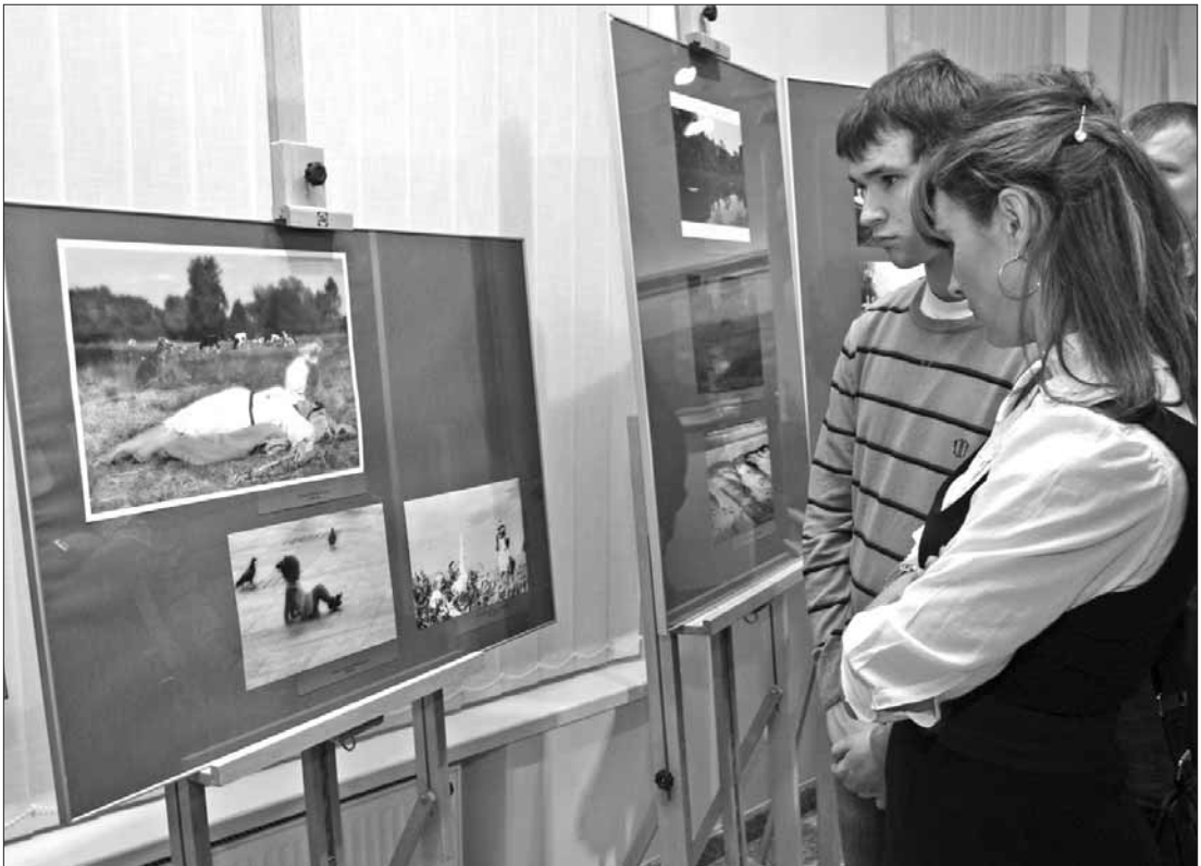
Wystawa pokonkursowa „Chelmoński” w Muzeum Mazowieckim

Za zmiany w programie redakcja nie ponosi odpowiedzialności.