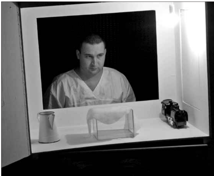
Teatr Zgoda z Warszawy wystąpi 15 grudnia w Galerii OTO JA

Płocka Galeria Sztuki (ul. Sienkiewicza 36), tel. 024/ 364 60 40, www.plockagaleria.com: wernisaż wystawy „Sztuka dawnej Japonii”. Projekty pomnika Bolesława Krzywoustego (wystawa po rozstrzygnięciu konkursu) oraz ozdoby świąteczne z elementami