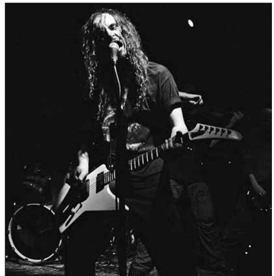
Na Rockowe Pożegnanie Lata zapraszamy 12 września