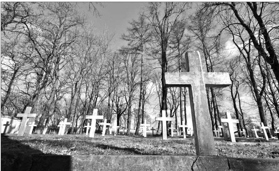
Wystawa „Miejsca pamięci narodowej” w Archiwum Państwowym czynna do końca października