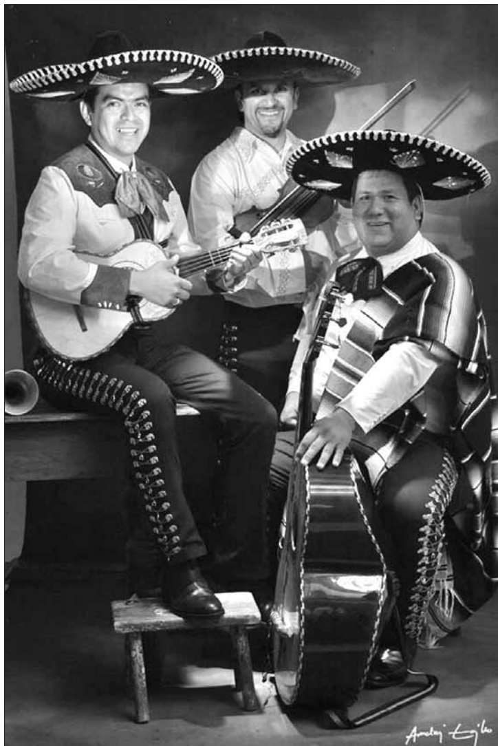
W ramach Dni Kultury Meksykańskiej w Domu Darmstadt wystąpi zespół Los Amigos (3 września)