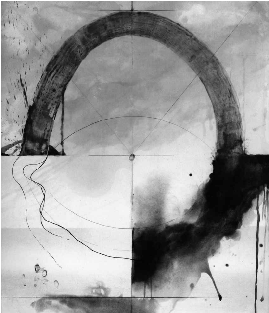
Grafika japońska w PGS od 17 grudnia

Za zmiany w programie redakcja nie ponosi odpowiedzialności.