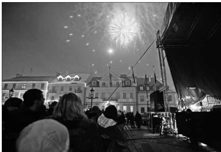
Sylwester przed ratuszem rozpocznie się o godz. 22

Młodzieżowy Dom Kultury (ul. Tumka 9), tel. 024/ 364 77 10, www.mdk-plock.pl: wernisaż wy-