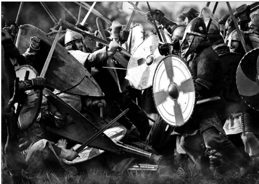
Wystawie dzieł Matejki towarzyszy pokonkursowa wystawa fotograficzna „Matejko”

Hala Sportowa Borowiczki (ul. Korczaka 10): Turniej Krajowy w Badmintonie, kat. senior i junior; godz. 10.