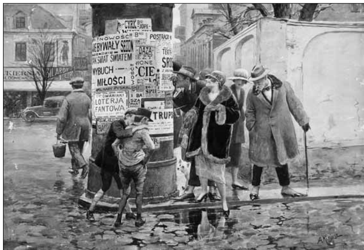
Wystawa Aleksego Kiriuszyna w Muzeum Mazowieckim

Filia biblioteczna nr 6 (ul. Czwartaków 4), tel. 024/ 263 50 34: „ Impre-