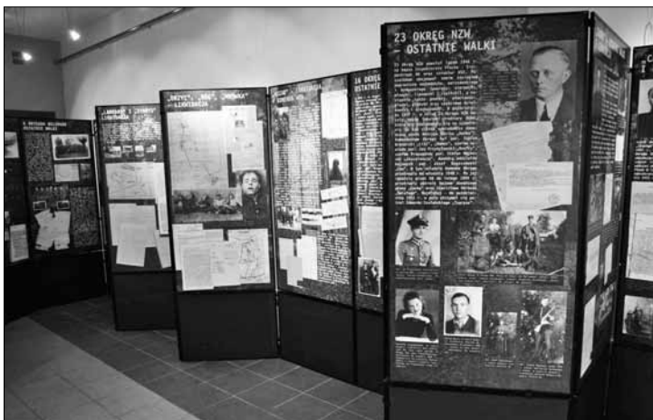
Wystawa „Ostatni Leśni” w galerii „Stanisławówki”

Książnica Płocka im. Wł. Broniewskiego (ul. Kościuszki 6), tel. 024/ 268 00 33, www.bibl.plock.pl: uroczyste rozstrzygnięcie i wręczenie nagród laureatom II edycji Turnieju Historycznego „Listopad 1918 r.” adresowanego do uczniów Zespołu Szkół Budowlanych nr 1, gimnazjów Płocka i powiatu płockiego, zorganizowanego przez ZSB nr 1 w Płocku. Uroczystości towarzyszyć będzie ekspozycja prac plastycznych wykonanych przez uczestników konkursu; godz. 11.30.