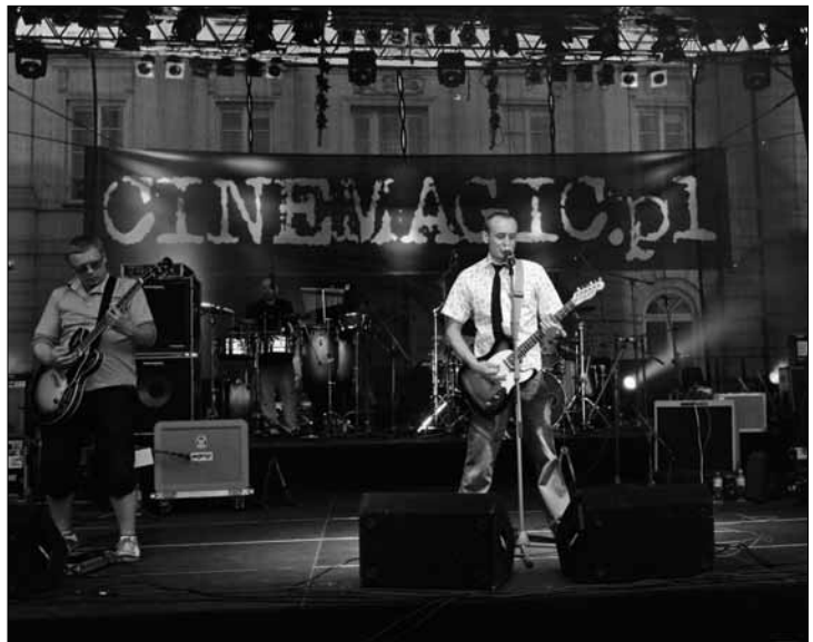
Lao Che wystąpi w Płocku 20 września

Dom Darmstadt (Stary Rynek 8), tel. 024/ 367 19 22, www.dd.pokis.pl: wykład Klausa Honolda , dziennikarza gazety „Darmstaedter Echo” nt. zburzenia Darmstadt podczas II wojny światowej. Wykład w języku nie-