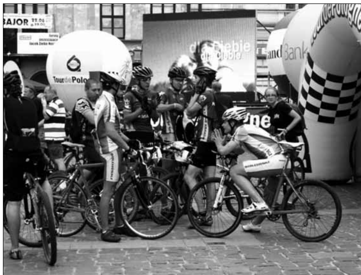
II etap Tour de Pologne – start 15 września na Starym Rynku

Filia biblioteczna nr 7 (ul. Gierzyńskiego 17), tel. 024/ 268 67 80: Podróż z książkami – cykl spotkań dla