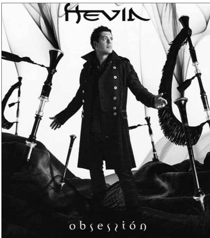
Gwiazda koncertu „Kolory nadzieji“ w amfiteatrze 27 września

Filia biblioteczna nr 1 (ul. Zielona 40), tel. 024/ 268 00 48: Ginający świat zwierząt – spotkanie dla dzieci z Alicją Bień – pracownikiem ogrodu zoologicznego; godz. 10.