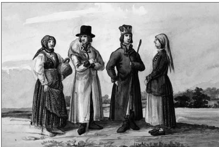
Strroje ludowe Polski i Ukrainy w Spichlerzu do 7 września

Filia biblioteczna nr 4 (ul. Krzywoustego 3), tel. 024/ 263 34 28: w ramach realizacji projektu „Literackie ABC dla każdego, kto Europę poznać chce” dofinansowanego przez Zarząd Województwa Mazowieckiego spotkanie autorskie z Grzegorzem Kasdepke; godz. 9.30.