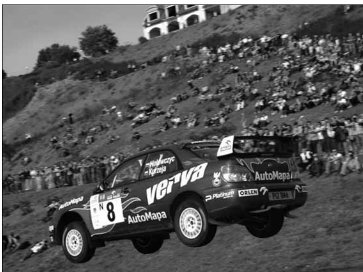
Rajd Orlen 20-21 września

Filia biblioteczna nr 8 (ul. Walecznych 20), tel. 024/ 263 46 92: w ramach realizacji projektu „Literackie ABC dla każdego, kto Europę poznać chce” dofinansowanego przez Zarząd Województwa Mazowieckiego, spotkanie autorskie z Grzegorzem Kasdepke; godz. 11.30.