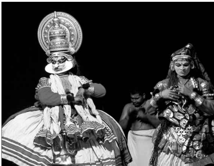
Podróż przez Indie w Domu Darmstadt 9 września

Galeria OTO JA (Pl. Narutowicza 2, wejście od „Knapki 10,5”), tel. 0 609 746 402, www.otoja.art.pl : Galeria prezentuje obrazy, rysunki i grafiki z kolekcji Oto JA. Na miejscu możliwość zakupu katalogów i plakatów z wystaw, koszulek, kubków, kartek pocztowych; od poniedziałku do piątku w godz. 14 – 17.30, wstęp wolny.