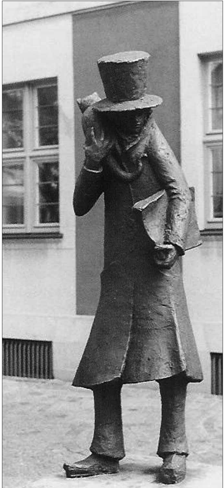
„Wspomnienie o Hoffmannie” – wystawa w Domu Darmstadt

Płocka Orkiestra Symfoniczna (sala koncertowa ul. Kolegiana 23), tel. 024/ 364 10 80, www.posorkie-stra.pl : FORTEPIAN IMPROWIZUJĄCY . Wykonawcy: Leszek Możdżer – fortepian , Płocka