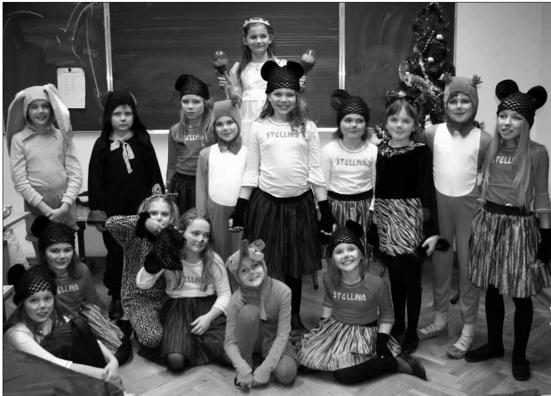
W Państwowej Szkole Muzycznej 5 lutego obejrzeć można muzyczną „Królową Śniegu”. Poprzednio uczniowie wystawili „Bal pod choinką”

Sala koncertowa PSM (ul. Kolejalna 23): Królowa Śniegu – przedstawienie muzyczne przygotowane przez uczniów i nauczycieli Ogólnokształcącej Szkoły Muzycznej, godz. 17, wstęp wolny.