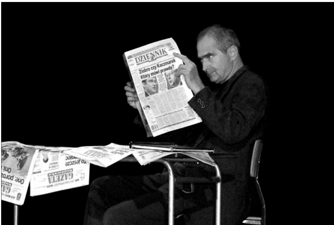
Olgierd Łukaszewicz wystąpi 22 października w Płocku w ramach Roku Wyspiańskiego w Książnicy Płockiej

Miejskie Centrum Sportu (ul. Sportowa 3), tel. 024/ 267 50 40, www.mzos.ump.pl : piłka nożna „11-ki” szkoły gimnazjalne – półfinały; godz. 10.