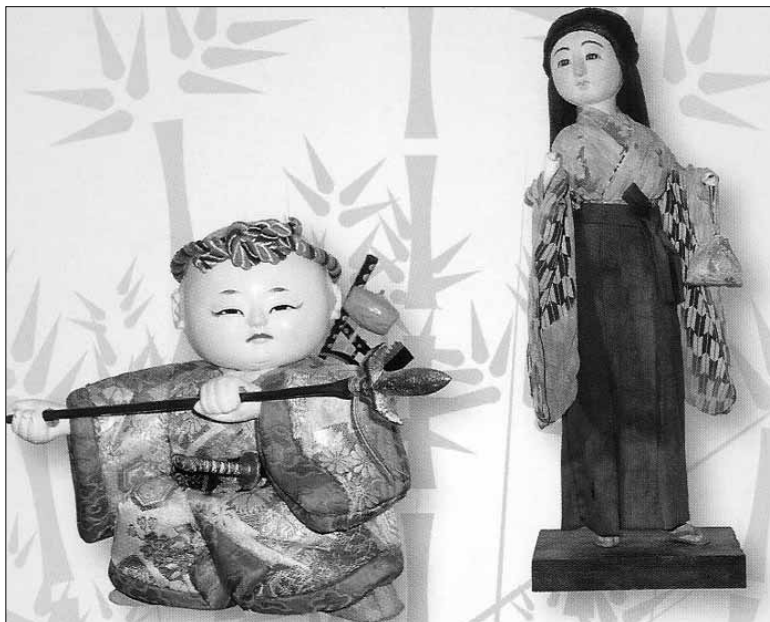
Wystawa „Lalki Japonii” w Domu Darmstadt czynna do 25 października

Biblioteka dla Dzieci im. W. Chotomskiej (ul. Sienkiewicza 2), tel. 024/ 262 27 69: przyjęcie urodzinowe na cześć Kubusia Puchatka. Wręczenie