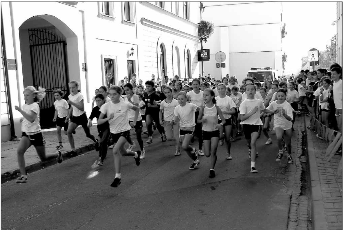
Bieg Tumski, 17 października na Starówce

ZHPiT „Dzieci Płocka” (al. Jachowicza 34), tel. 024/262 60 71 i 024/262 48