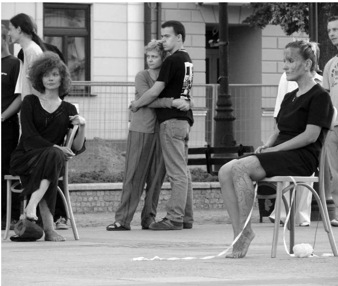
Karawan Sztuki w spektaklu „Sen” na Starym Rynku 10 sierpnia o godz. 19

Rynek Starego Miasta , www.pokis.pl : „Rynek Sztuki” wystąpią Te-