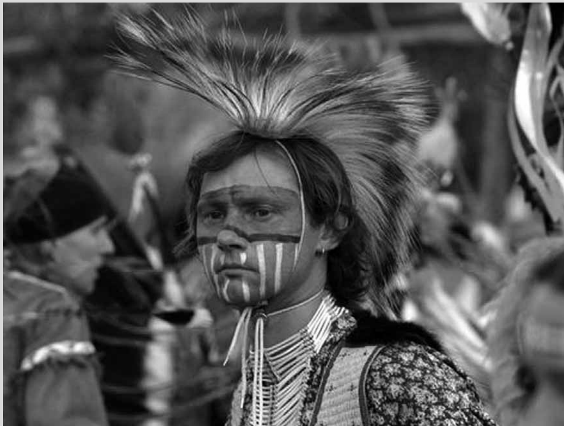
Otwarcie wystawy o sztuce Indian połączone z występem zespołu Huu-Ska Luta, PGS, 22 sierpnia o godz. 17

Pływalnia Miejska (al. Kobylińskiego 28), tel. 024/ 262 51 86, www.zmos.um.pl: Zabawa na wodzie- zakończenie lata – gry i zabawy dla dzieci ze świetlic środowiskowych i dzieci w wieku 7-12 lat, zgłaszających się indywidualnie; 29 sierpnia od godz. 10.