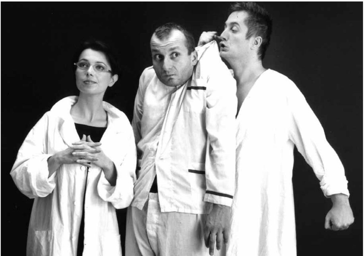
Płocka Noc Kabaretowa – Płocki Ośrodek Kultury i Sztuki, 30 czerwca