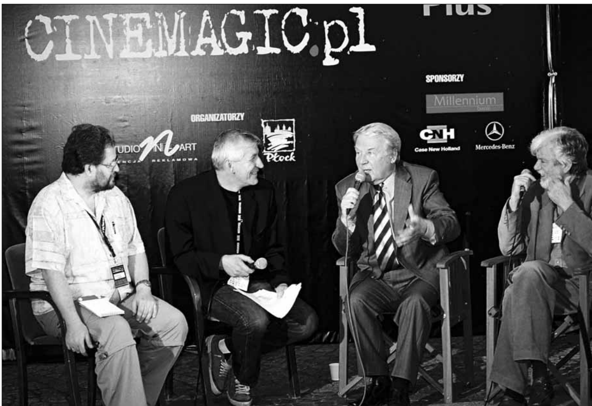
II Międzynarodowy Festiwal Zawodów Filmowych “Cinemagic”, Stary Rynek, 22 czerwca

Klub Osiedla Łukasiewicza (ul. Łukasiewicza 28), tel. 024/ 263 94 12: Być zawsze dla innych – spotkanie wolon-