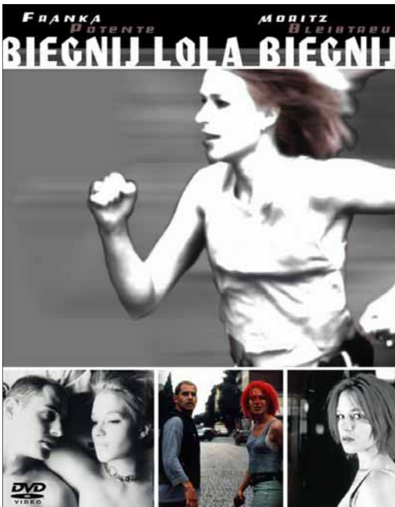
W ramach cyklu „Kino niemieckie” pokaz filmu „Biegnij, Lola, biegnij” w Domu Darmstadt” 12 kwietnia

Dom Darmstadt (Stary Rynek 8), tel. 024/ 367 19 22, www.pokis.pl/dd: otwarcie wystawy pt. „Malarstwo” Zygmunta Szczepankowskiego, godz.18. Ekspozycja czynna do 3 maja, wstęp wolny.