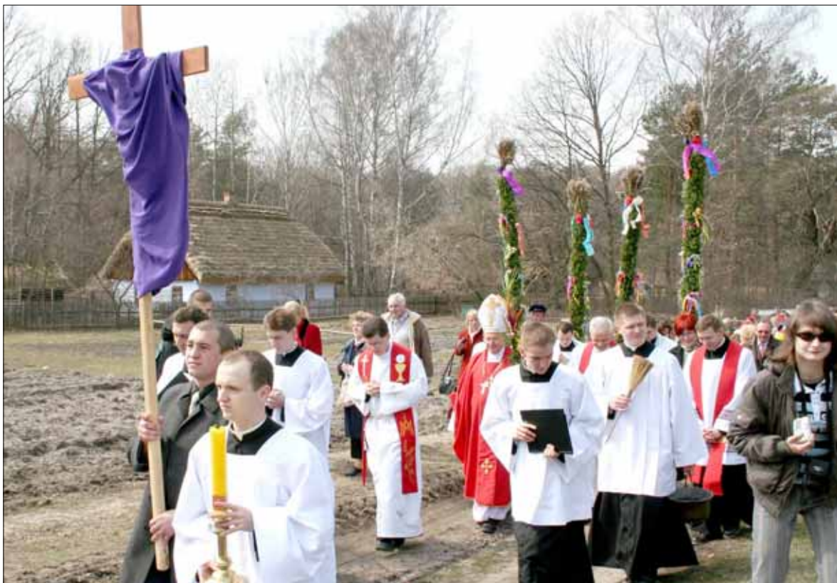
Niedziela Palmowa w Muzeum Wsi Mazowieckiej w Radomiu (1 kwietnia)

Miejski Zespół Obiektów Sportowych (hala sportowa w Borowiczkach), tel. 024/ 264 85 18: finał