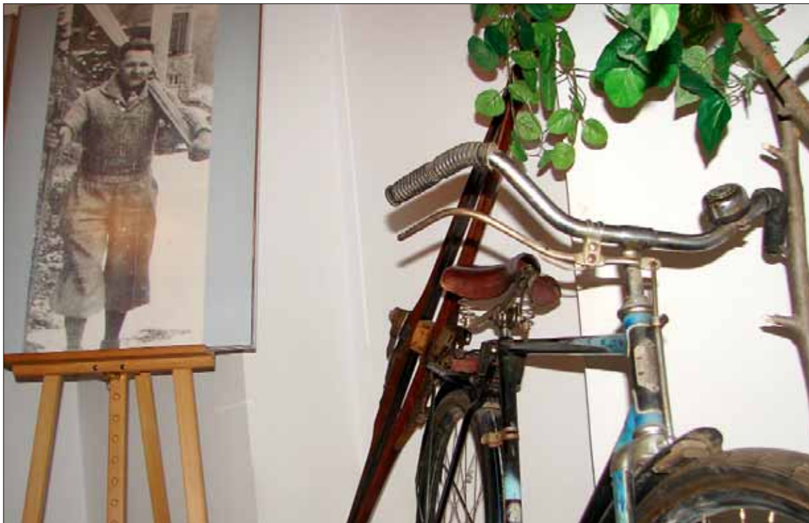
„Wierszem Kocham i wierszem cierpię” – wieczór czytania poezji Władysława Broniewskiego w ramach projektu „Maje i listopady” w Książnicy Płockiej, 19 kwietnia

Młodzieżowy Dom Kultury (ul. Tum ska 9), tel. 024/ 364 77 10: koncert zespołu muzycznego Bohomaz; godz. 19.