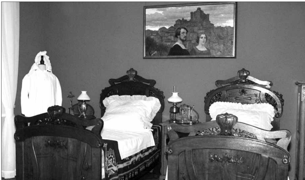
Muzeum Mazowieckie obchodzi jubileusz 185-lecia