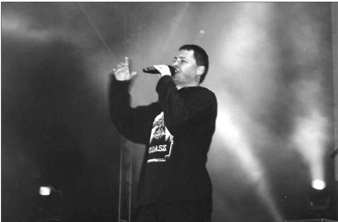
Farben Lehre zaprasza 9 września na swoje 20. urodziny