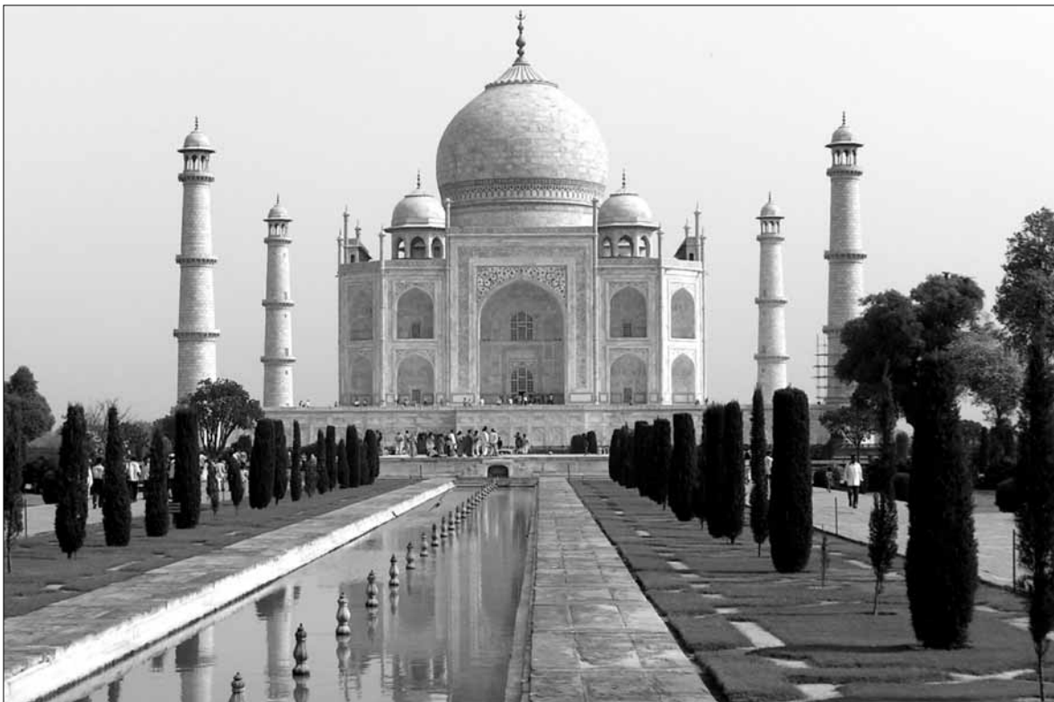
W Domu Darmstadt 11 września można odbyć slajdową podróż do Indii

Klub Osiedla Łukasiewicza , (ul. Łukasiewicza 28), tel. 024 263 94 12, “Na dobry początek” – rozpoczęcie roku kulturalno – oświatowego 2006/2007, godz.17.