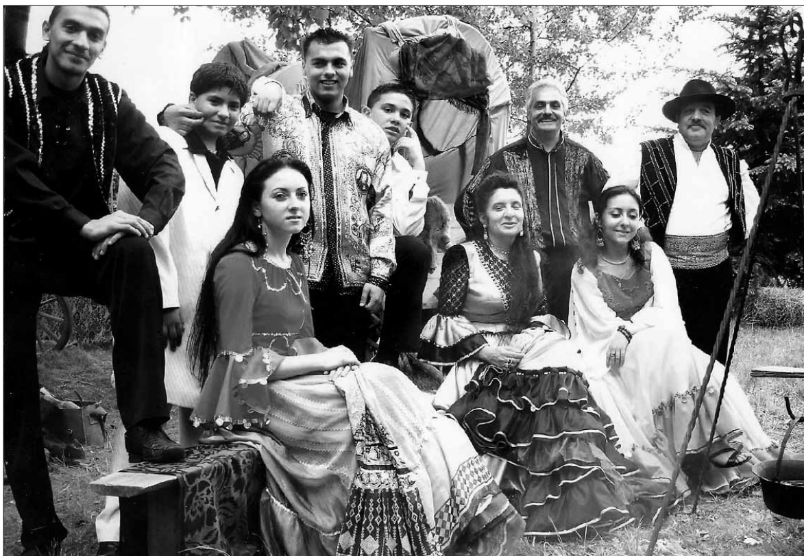
Zespół „Romen” zaprasza 7 lipca na Piknik Romski

Zajęcia dla dzieci w poniedziałki, wtorki, środy i piątki w godz. 11 – 14