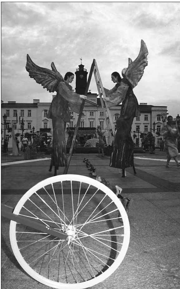
Teatr „Feta” ponownie wystąpi podczas Nadwiślańskiego Festiwalu Teatrów Ulicznych