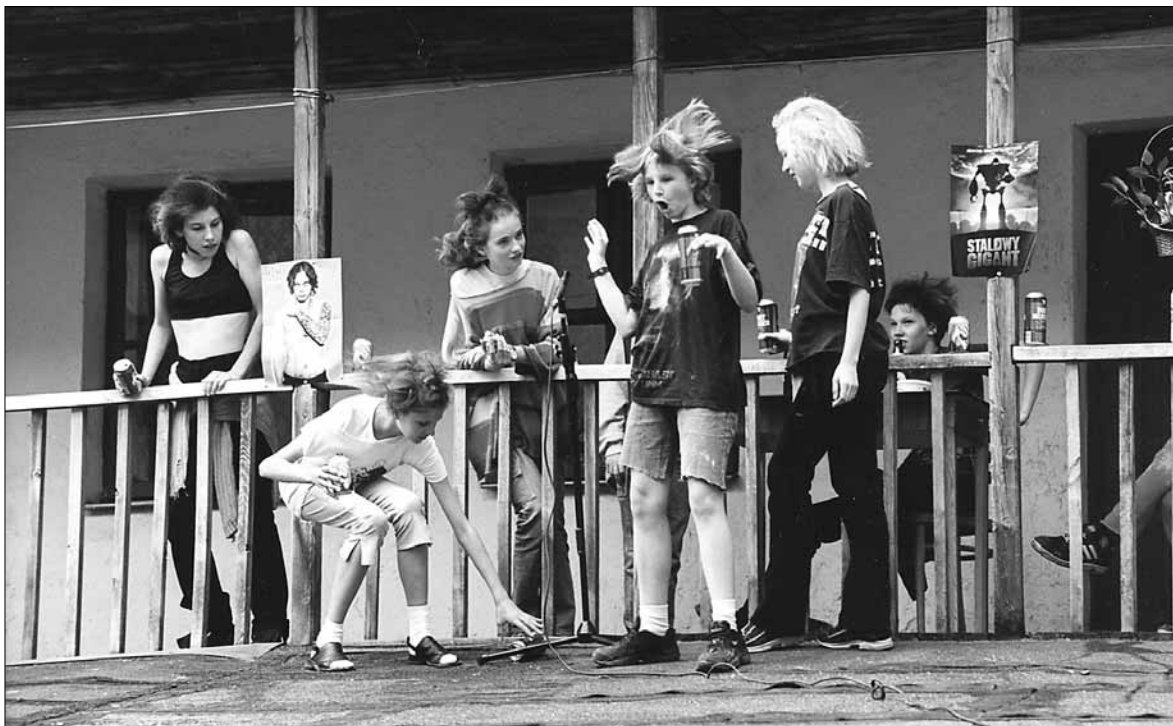
Akcja „Podwórko” w 2005 roku