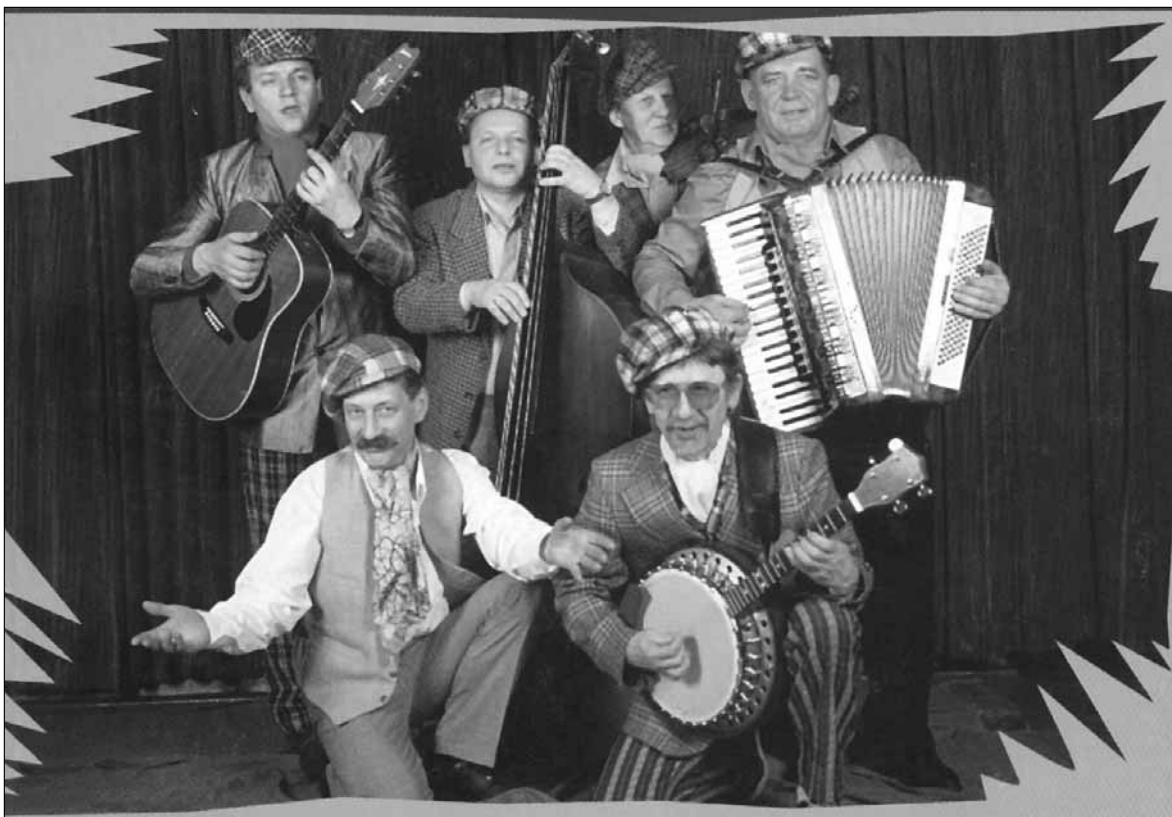
Płocka Kapela Podwórkowa zaprasza na majówkę z okazji 10-lecia zespołu

Klub Osiedla Łukasiewicza (ul. Łukasiewicza 28): „U jeża kuśnierza” – gry i zabawy dla dzieci najmłodszych; godz.15, wstęp wolny, tel. 263 94 12