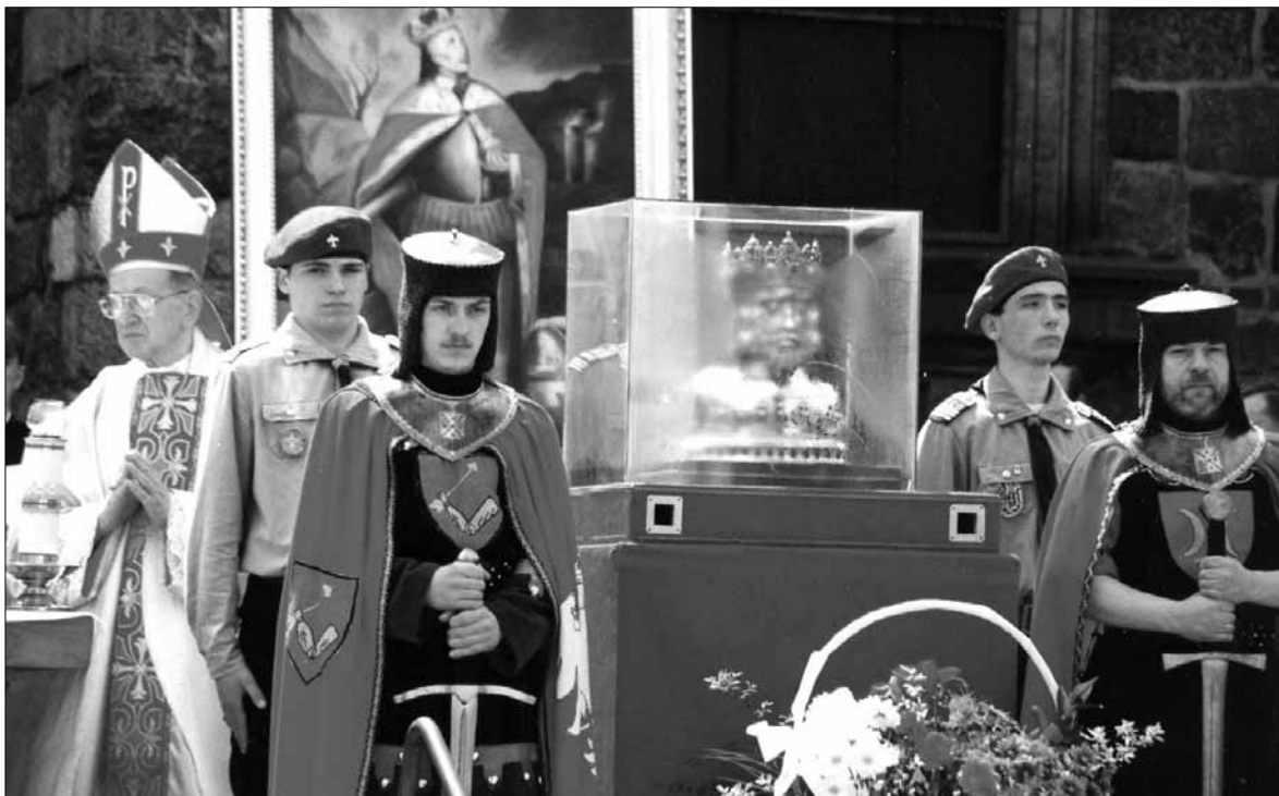
Uroczystości Zygmontowskie na rynku Starego Miasta, 7 maja

Książnica Płocka (ul. T. Kościuszki 6): „Polska – mój kraj” – wystawa fotograficzna przygotowana we współpracy z NBP w Warszawie; czynna codziennie do 13 maja w godz. 10-18, w soboty 10-14; „Szesnastu – wystawa prezentująca losy 16 przywódców Polskiego Państwa Podziemnego, porwanych, sądzonych i skazanych w procesie moskiewskim w 1945 r.” Wystawa przygotowana przy współpracy z Instytutem Pamięci Narodowej w Warszawie; czynna codziennie do 31 maja w godz. 10-18, w soboty 10-14 tel. 268 00 33