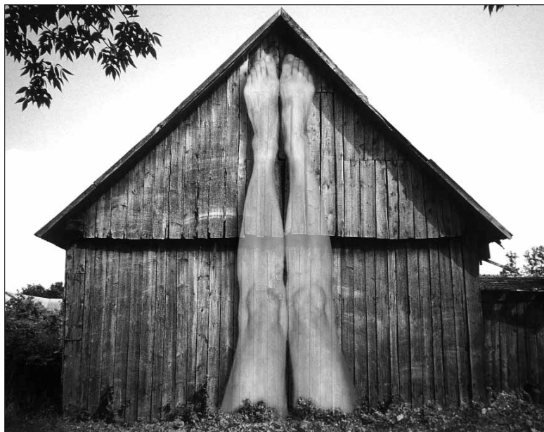
Soczewka 2005 – wystawa poplenerowa w TNP

Filia biblioteczna nr 12 (ul. Browarna 8): Idzie wiosna oraz Ozdoby świąteczne – zajęcia plastyczne dla najmłodszych czytelników odbywają się w każdy piątek w godz. 15-16.30, tel. 261 20 19