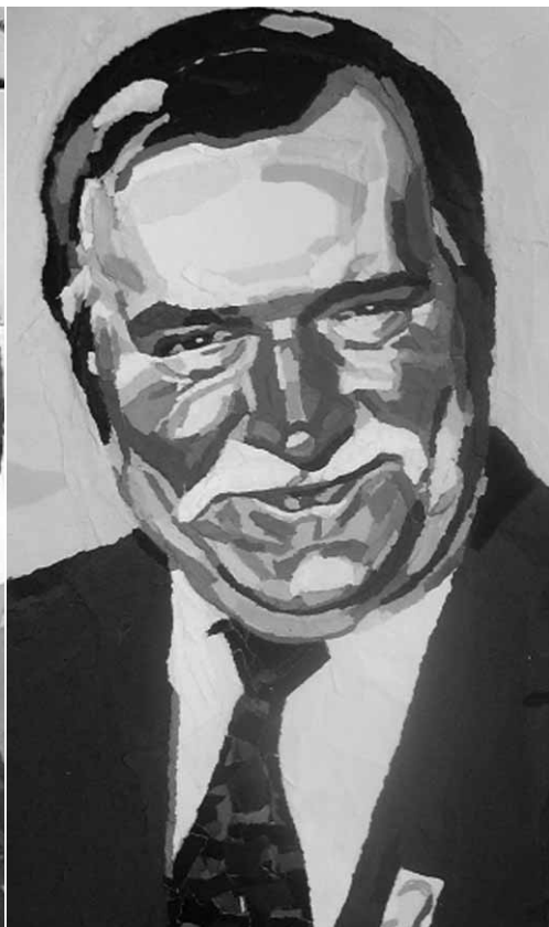
„Dwadzieścia jeden portretów” Iliana Sawkowa w Domu Darmstadt od 9 lutego