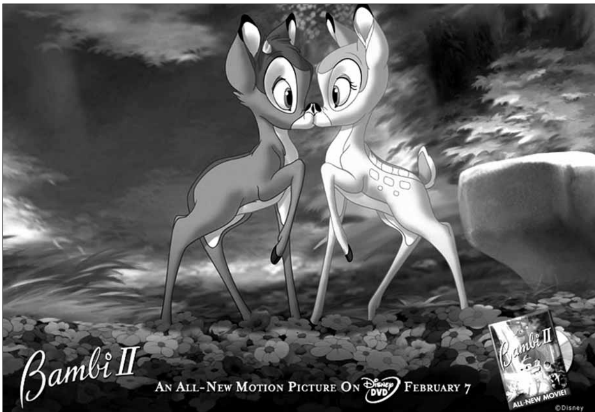
Druga część kultowej kreskówki w kinie Przedwiośnie

w poniedziałki i wtorki w godz. 10.30-11.30, tel. 266 87 06