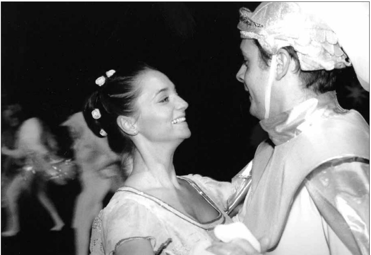
Spektakl „Calineczka” w sali koncertowej PSM

Gimnazjum nr 8 (ul. Kutrzeby): Piłka Ręczna Dziewcząt Szkół Gimnazjalnych; godz. 10, wstęp wolny