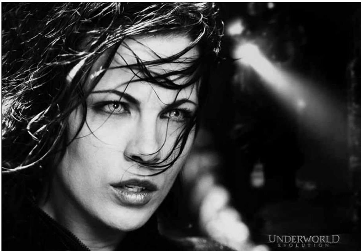
W kinie Przedwiośnie od 1 lutego

Filia biblioteczna nr 9 (ul. Orzechowa 5a): „Koło małych przyjaciół książek” - zabawy z książką dla dzieci, spotkania z udziałem opiekunów;