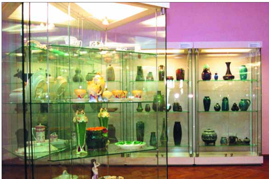
Szkoło i porcelana secesyjna na III piętrze Muzeum Mazowieckiego

Książnica Płocka (ul. T. Kościuszki 6): „Świat jest bardziej skomplikowany niż nasze prawdy o nim. Stefan Themerson 1910 Płock – 1988 Londyn.” Wystawa przygotowana w 95. rocznicę urodzin artysty z materiałów pochodzących z Archiwów Themersonów w Londynie i Katowicach, ze zbiorów prywatnych Małgorzaty Sady, BWA w Lublinie, Muzeum Sztuki w Łodzi, Muzeum Książki Dziecięcej w Warszawie, Biblioteki im. Zielińskich TNP, Archiwum Państwowego w Płocku, Urzędu Stanu Cywilnego w Płocku, Biblioteki Wyższego Seminarium Duchownego w Płocku, Teatru im. Stefana Jaracza w Łodzi, Miejskiego Teatru „Miniatura” w Gdańsku, Teatru Powszechnego im. Jana Kochanowskiego w Radomiu, a także z kolekcji Franciszka Olkowskiego i Marka Grali oraz księgozbioru Książnicy Płockiej; czynna od poniedziałku do piątku w godz. 10 – 18, soboty w godz. 10 – 14, tel. 268 00 32