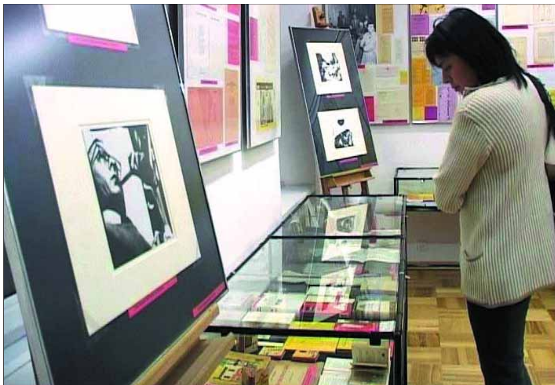
Wystawa w Książnicy Płockiej poświęcona życiu i twórczości Stefana Themersona

Klub Osiedla Dworcowa (ul. Chopina 64A): „Zgaduj zgadula dla dzieci” – godzina ciekawych pytań i odpowiedzi; godz.15, wstęp wolny, tel.262 72 08