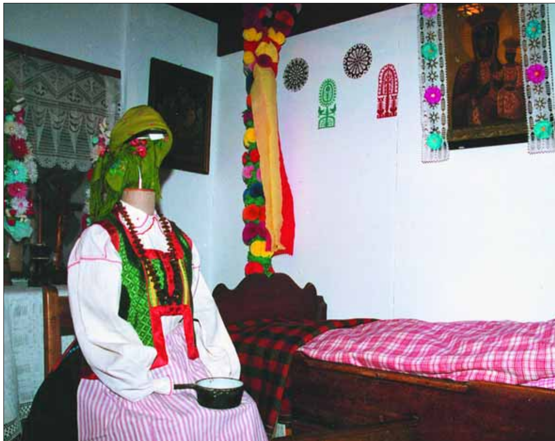
Wystawa czasowa w plockim Spichlerzu

Filia biblioteczna nr 1 (ul. Zielona 40): „Moje szczęśliwe życie” wystawa o życiu i twórczości ks. Jana Twardowskiego, czynna w poniedziałki, wtorki, środy i piątki w godz. 10 – 18, czwartki w godz. 10 – 14; „Klub Małego Dziecka” – zajęcia z książką dla dzieci w wieku 2 – 5 lat wraz z opiekunami odbywają się codziennie poza czwartkiem; godz. 14, tel. 262 27 69