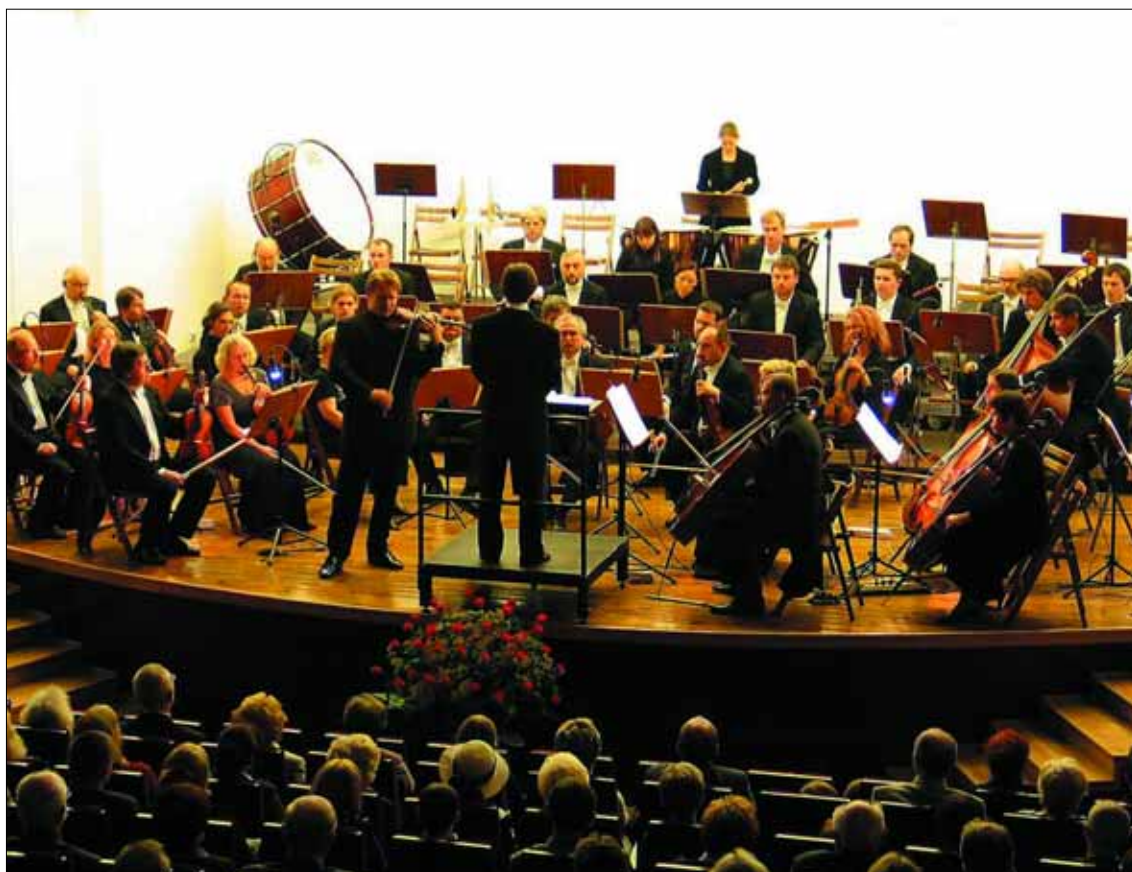
Koncerty świąteczne Płockiej Orkiestry Symfonicznej

Stary Rynek: „Sylwester przed Ratuszem” w programie występ zespołów „Boney M SHOW” i „For Eyes ABBA” – wykonujących covery legendarnych grup disco z lat 70. oraz zespołu Queens; godz. 22, tel. 367 19 20