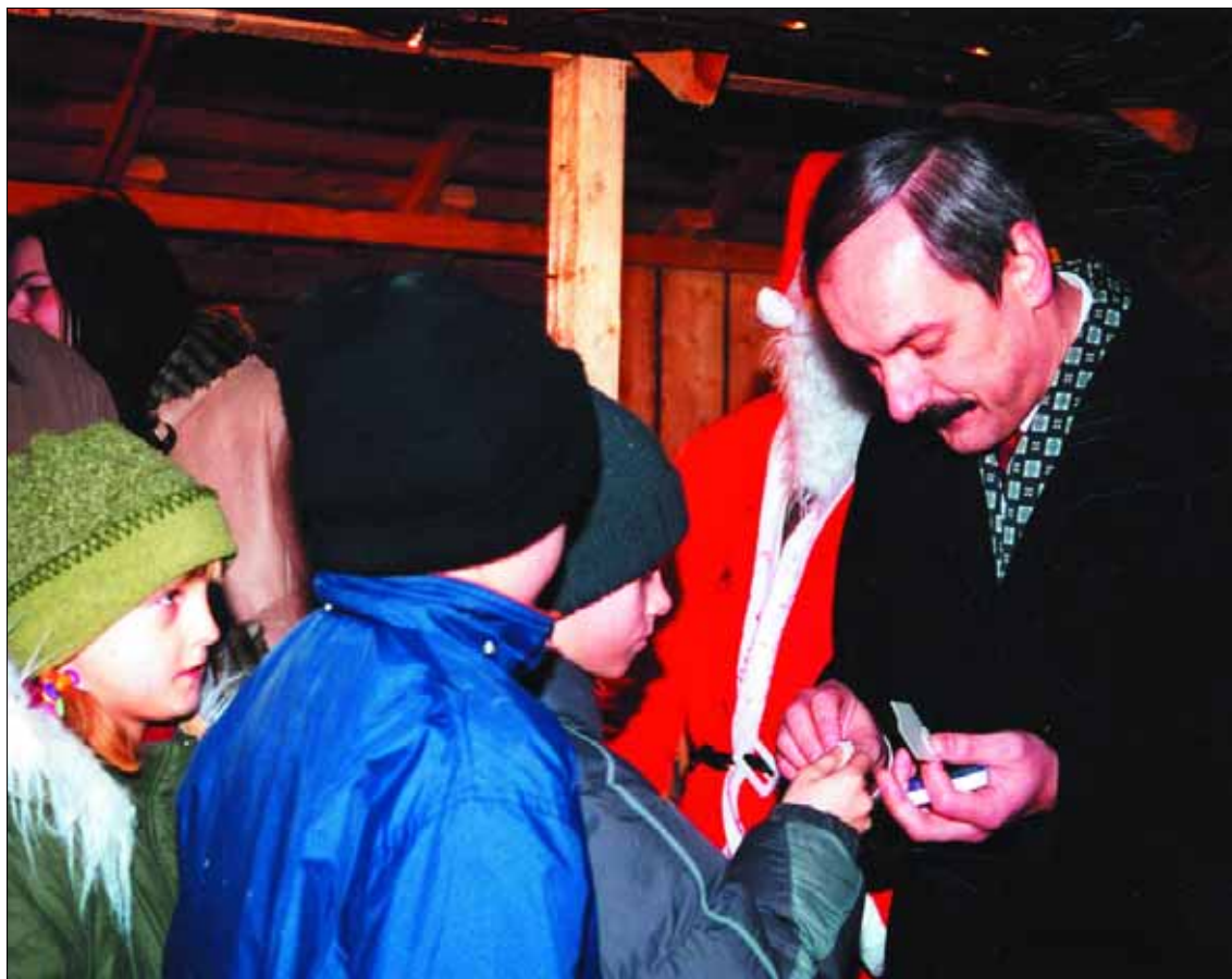
Wigilia przed Ratuszem, 18 grudnia

Spółdzielczy Dom Kultury (ul. Krzywoustego 3): „Pocztówka do Świętego Mikołaja” – konkurs plastyczny; godz. 16, tel. 263 35 60