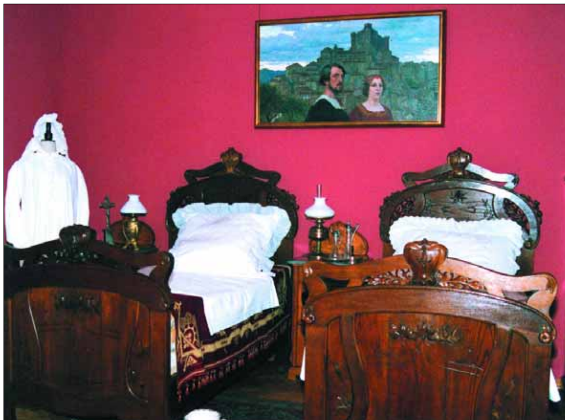
Wnętrze secesyjne w Muzeum Mazowieckim

Filia biblioteczna nr 3 (ul. Rembelskiego 11): w cyklu „Każde dziecko to potrafi – aniołki z masy solnej” – zajęcia plastyczne dla