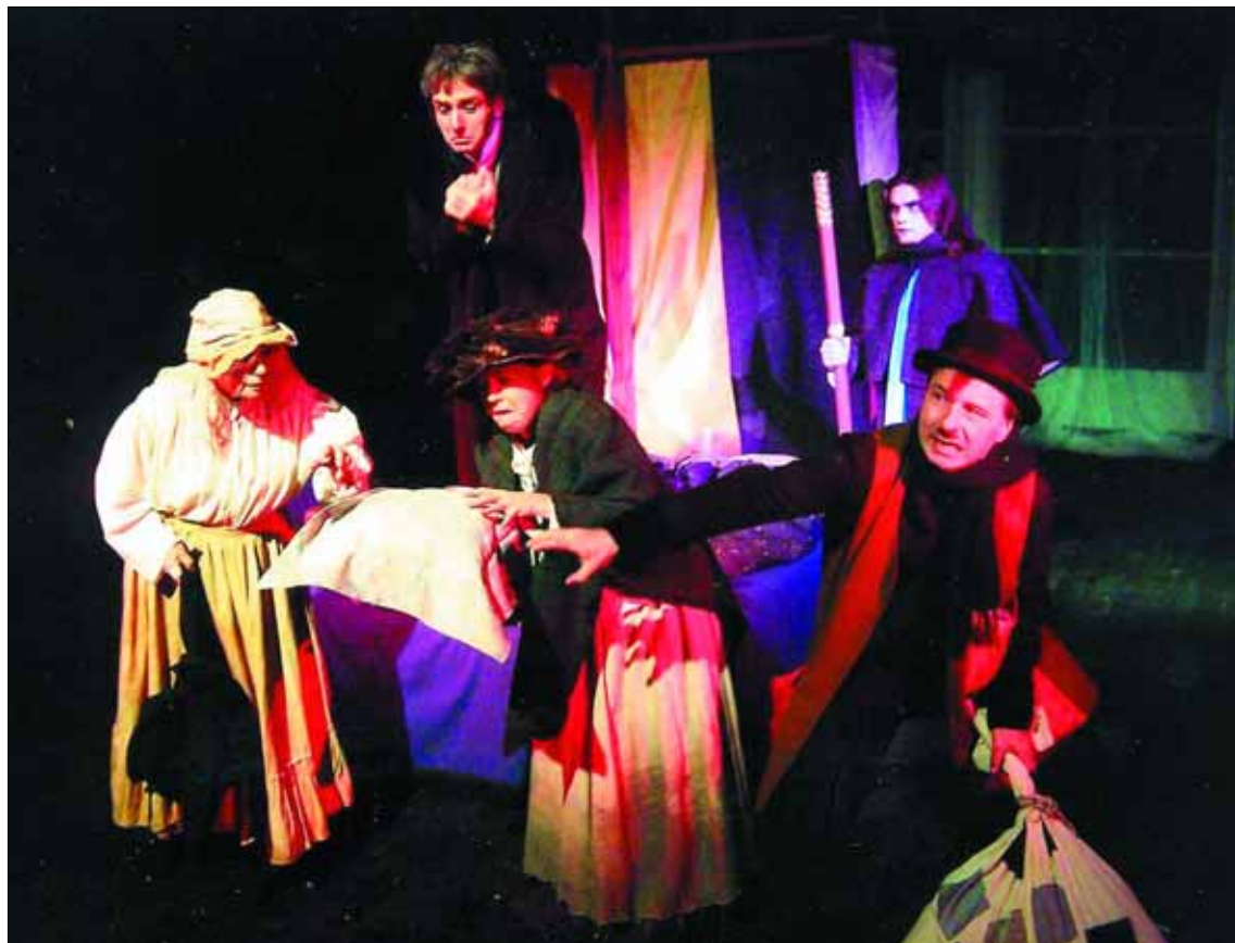
„Opowieść Wigilijna” w Teatrze Dramatycznym