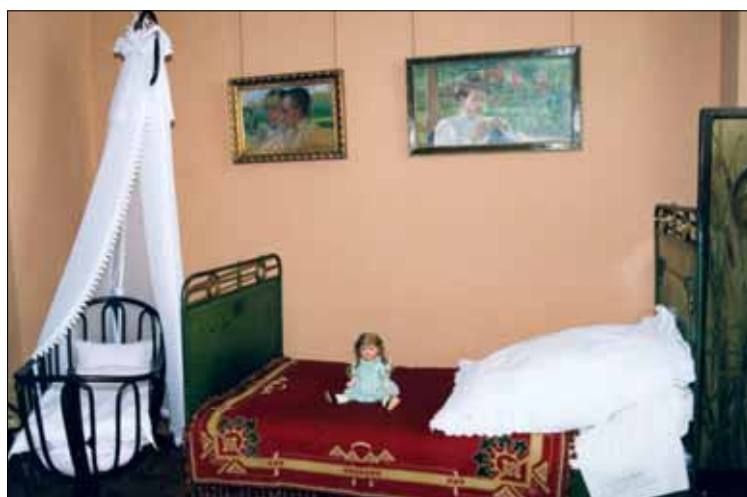
Otwarcie III części Muzeum Mazowieckiego nastąpi 25 listopada

Hala Sportowa w Borowiczkach (ul. Korczaka 10): III Turniej