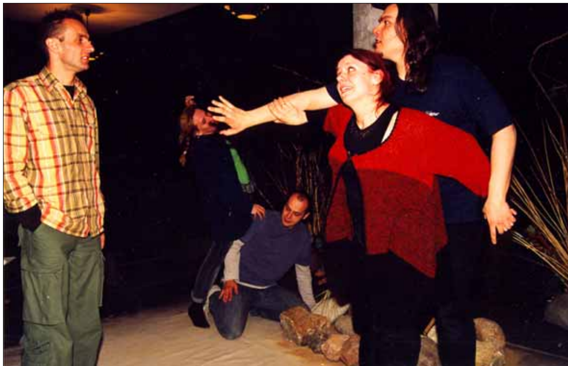
Teatr Dramatyczny: scena z „Życia do natychmiastowego użytku”