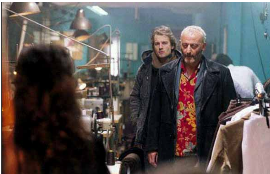
Przedwiośnie: „Imperium wilków” z J. Reno

Kino Przedwiośnie (ul. Tumska 5a): „Magiczna karuzela”, „Wyspa”, tel. 262 25 65, www.przedwiosnie.maxfilm.com.pl