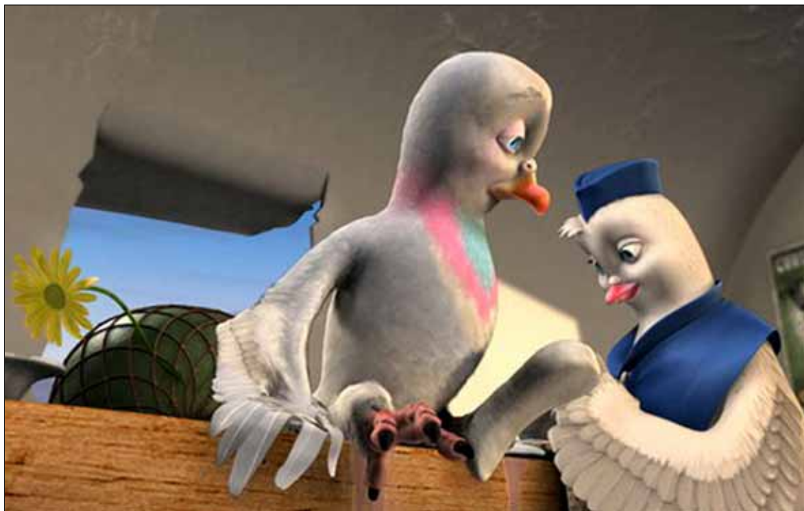
Przedwiośnie: Do naszego kina przyleciał „Szeregowiec Dolot”

Kino Przedwiośnie (ul. Tumska 5a): „Miasto Gniewu”, „Czas surferów”, „Skazany na bluesa”, tel. 262 25 65, www.przedwiosnie.maxfilm.com.pl