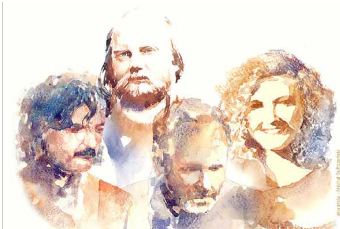
Na koncercie z okazji 25-lecia Solidarności wystąpi m.in. grupa „Pod Budą”

Hala Sportowa w Borowiczkach (ul. Korczaka 10): Krajowy Turniej Juniorów Młodszych w Badmintonie; początek o godz. 9; wstęp wolny, tel. 264 85 18