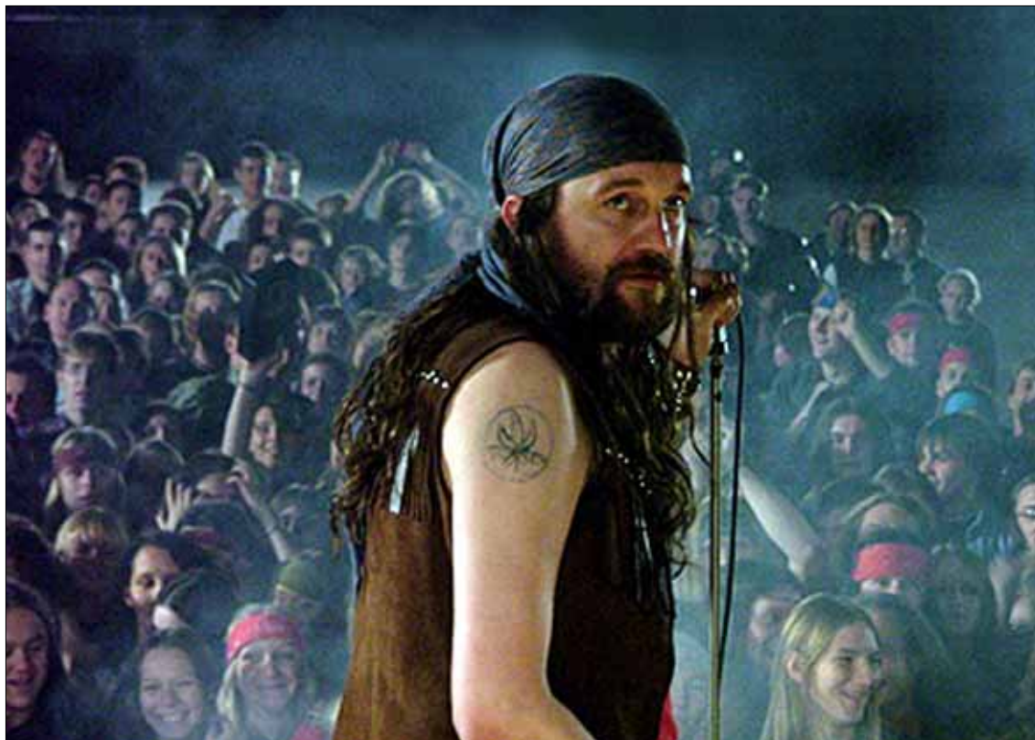
Przejmująca historia życia lidera grupy Dżem w filmie „Skazany na bluesa”