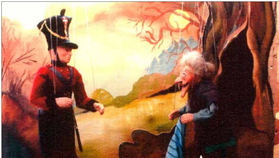
Wystawa lalek z Pilzna w Domu Darmstadt