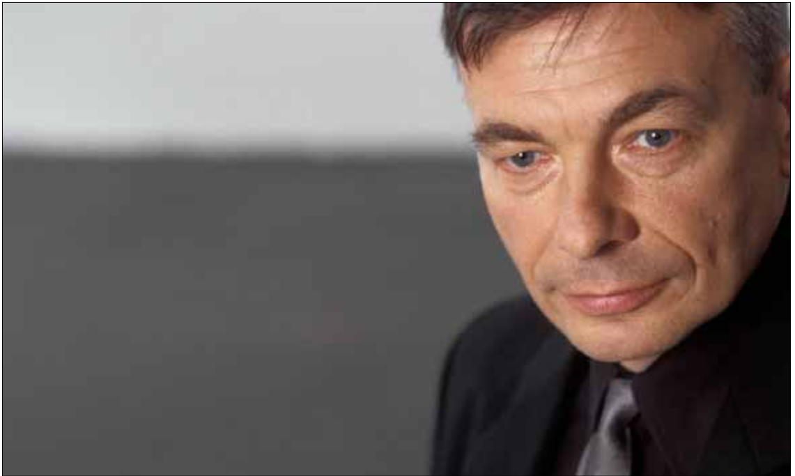
FeMEV Płock 2005: Karl Bartos – jeden z klasycznych członków legendarnej niemieckiej grupy Kraftwerk – to nie tylko muzyk, ale również prekursor wszelkich form wizualizacji