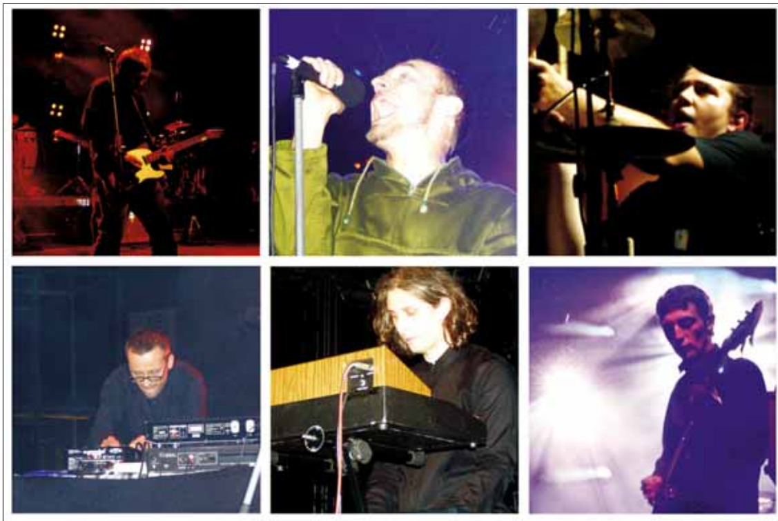
Rockowe Ogródki Płock 2005: grupa Lao Che