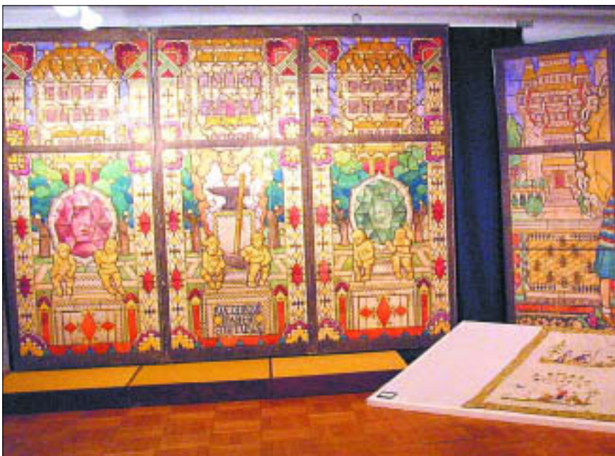
Wystawa czasowa „Józef Mehoffer – ze zbiorów Muzeum Mazowieckiego”

10.00 – 18.00 „Wszystko kończy się piosenką” – wystawa poświęcona życiu