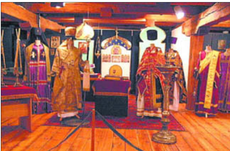
„Prawosławie w Polsce”. Muzeum Mazowieckie w Płocku, Dział Etnografii, ul. Kazimierza Wielkiego 11 B

Centrum Kinowe Mazowsze; tel. 262 25 65; www.ck-mazowsze.plock.pl; „Marzyciele”, „Lepiej późno, niż później”, „Scooby Doo 2”