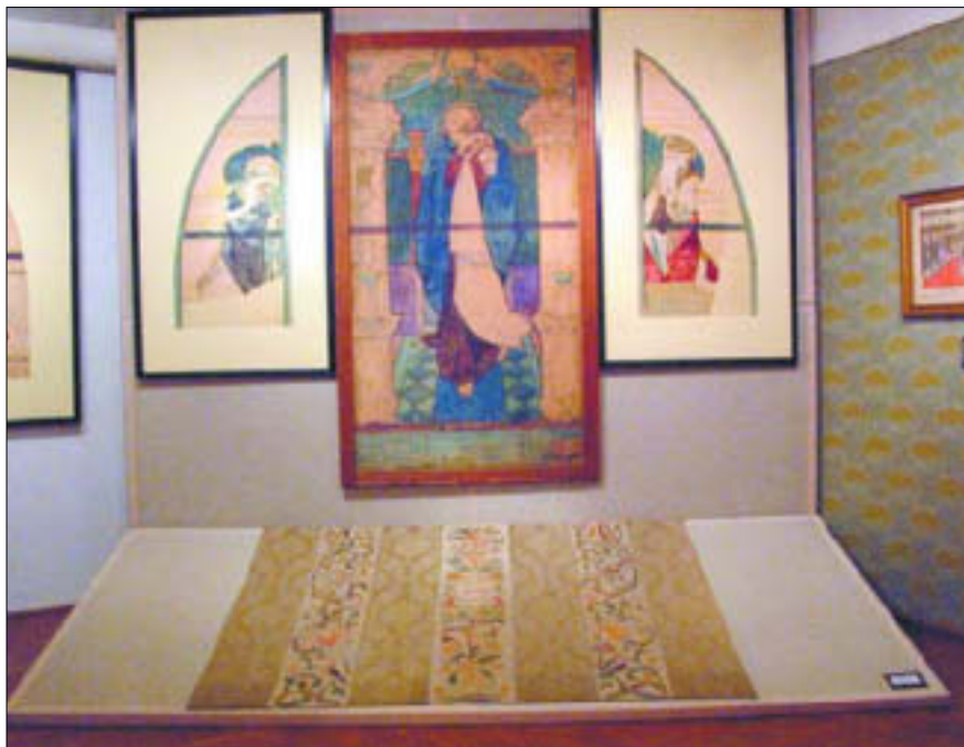
Wystawa czasowa „Józef Mehoffer – ze zbiorów Muzeum Mazowieckiego”

10.00 – 18.00 „Płoccy kusznicy” – wystawa z okazji 10-lecia Płockiej Drużyny Kuszniczej. Książnica Płocka – filia biblioteczna nr 3, ul. Rembielińskiego 11; tel. 263 01 05