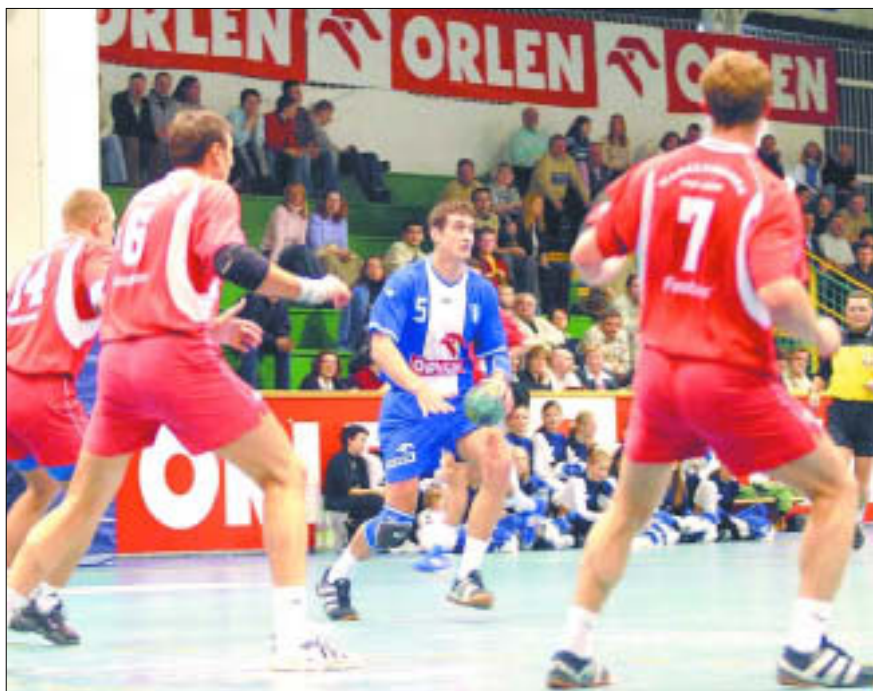
Wisła Płock SSA – MMTS Kwidzyn. Ekstraklasa piłki ręcznej