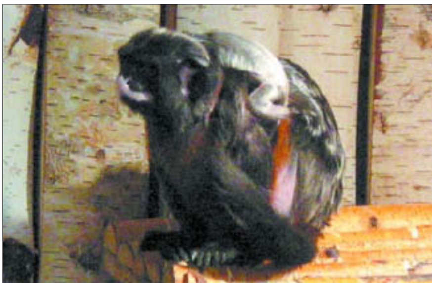
Miejski Ogród Zoologiczny