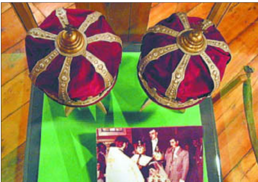
„Prawosławie w Polsce”. Muzeum Mazowieckie w Płocku, Dział Etnografii, ul. Kazimierza Wielkiego 11 B

10.30 – 11.30 „Koło małych przyjaciół książek” zabawy z książką dla dzieci. Książnica Płocka – filia biblioteczna nr 9, ul. Orzechowa 5a; tel. 266 87 06