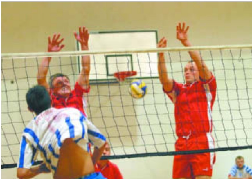
Hala Sportowa Borowiczki – I Otwarty Turniej Siatkówki Mężczyzn

10.00 – 14.00 „Cóżem winien, żem tak się nabłąkał...” wystawa poświęcona życiu i twórczości K.I.Gałczyńskiego. Książnica Płocka, ul. Kościuszki 6; tel. 268 00 32