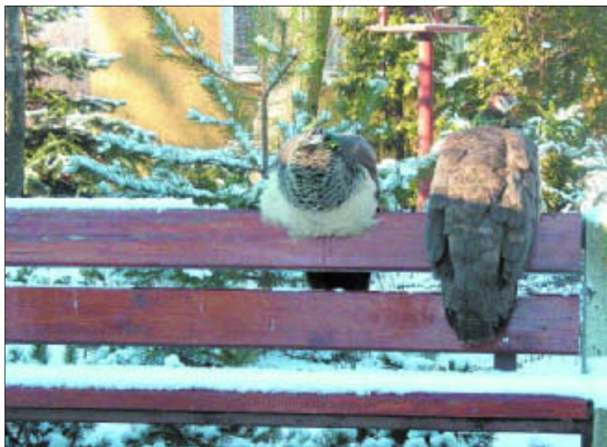
Miejski Ogród Zoologiczny