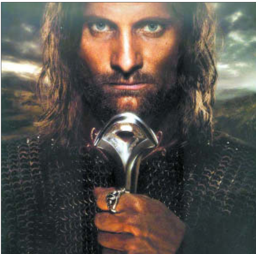
Centrum Kinowe Mazowsze – „Władca pierścieni: Powrót króla”

16.00 „Zima na szkle malowana” – zajęcia plastyczne dla dzieci i młodzieży. Spółdzielczy Dom Kultury, ul. Krzywoustego 3. Wstęp wolny; tel. 263 35 60