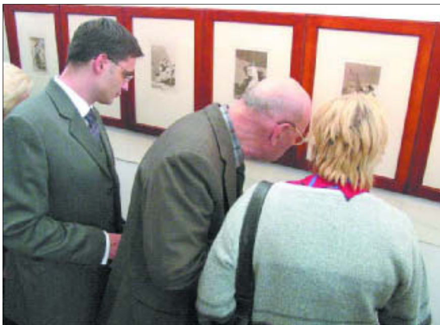
Muzeum Mazowieckie w Płocku – wystawa czasowa: „Francisco Goya y Lucientes Los Caprichos”

16.00 „Zimowe krajobrazy” – konkurs plastyczny w kole „Miniaturki”. Klub Osiedla Dworcowa, ul. Chopina 64A. Wstęp wolny, tel. 262 72 08