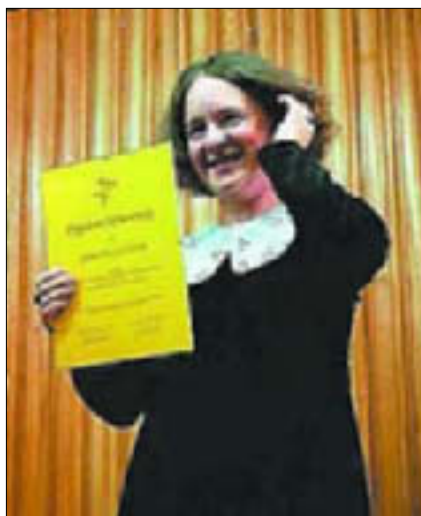
Książnica Płocka, filia biblioteczna nr 13 – spotkanie autorskie z Dorotą Gellner – poetką, autorką tekstów piosenek oraz scenariuszy programów telewizyjnych i radiowych dla dzieci

16.00 „Wielki karnawał” – konkurs plastyczny dla dzieci i młodzieży. Klub Osiedla Kochanowskiego, ul. Obr. Westerplatte 6a. Wstęp wolny; tel. 262 79 96 wew.104