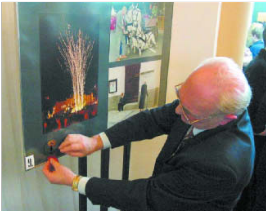
Książnica Płocka – otwarcie wystawy fotografii członków Płockiego Towarzystwa Fotograficznego im. A. Macieszy „Mój Płock”

16.00 „U Babci jest słodko” – koncert z okazji Dnia Babci i Dziadka. Klub Osiedla Kochanowskiego, ul. Obr. Westerplatte 6a. Wstęp wolny; tel. 262 79 96 wew.104