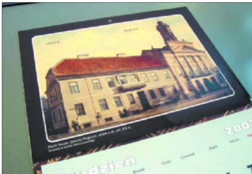
Dom Darmstadt – wystawa: „Płockie kalendarze”

w Płocku, Dział Etnografii, ul. Kazimierza Wielkiego 11 B. Bilety: 2 zł norm., 1 zł ulg., przewodnik 10 zł, tel. 262 25 95