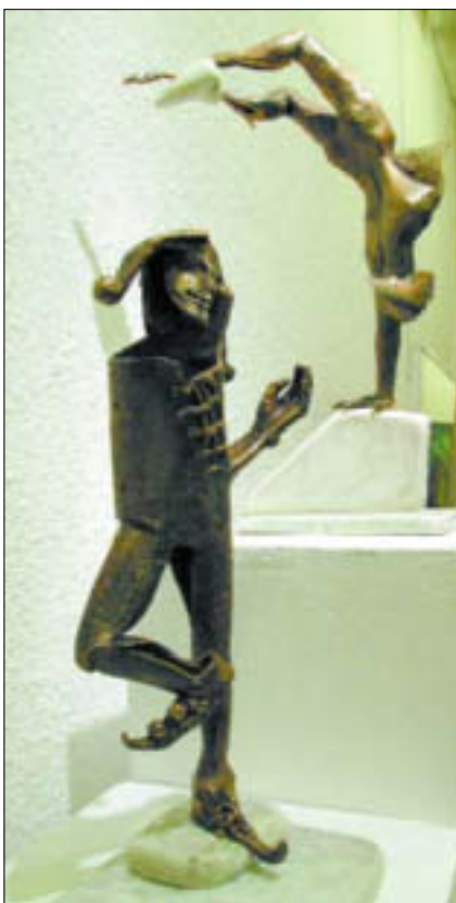
w Warszawie. Dom Darmstadt, Stary Rynek 8. Wstęp wolny; tel. 264 11 11

10.00 – 18.00 Wystawa: „Grafika bułgarska” zorganizowana we współpracy z Bułgarskim Instytutem Kultury