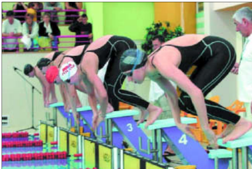
Pływalnia Miejska Podolanka – zimowe mistrzostwa Polski juniorów 16-lletnich

16.00 „Zimowe sny” – konkurs plastyczny dla dzieci. Klub Osiedla Kochanowskiego, ul. Obr. Westerplatte 6a. Wstęp wolny; tel. 262 79 96 www.104