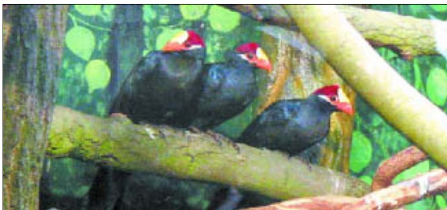
Miejski Ogród Zoologiczny

9.00 – 16.00 Miejski Ogród Zoologiczny. Kasa czynna do 15.00, ul. Norbertańska 2. Bilety: 5 zł, 3 zł, bilet zbiorowy (min. 10 osób) 2 zł; tel. 366 05 14