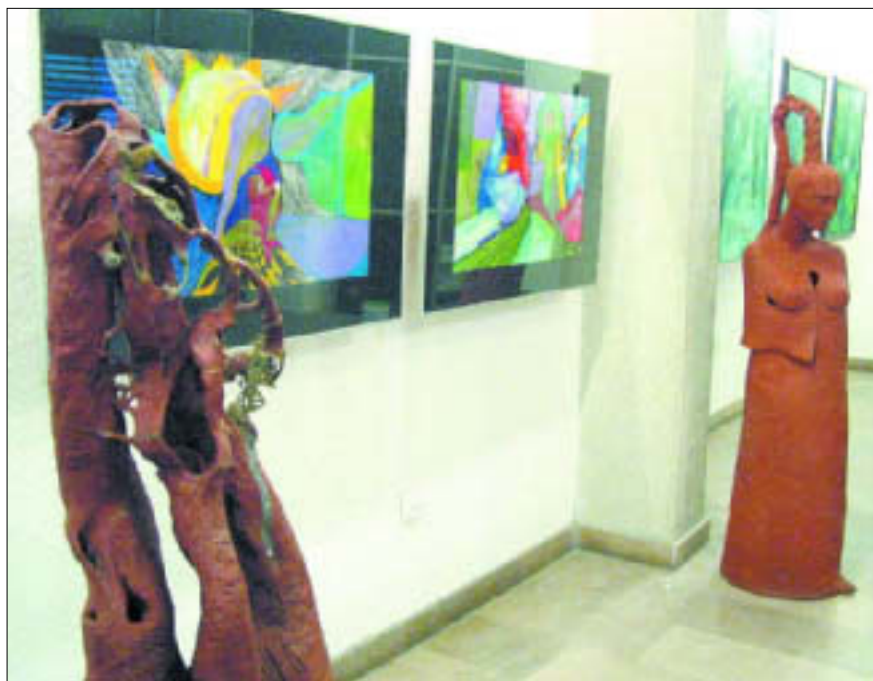
Płocka Galeria Sztuki – wystawa: „Ogród zaklęty”