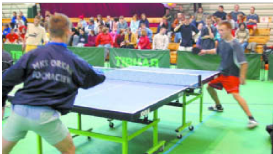
Hala Sportowa Borowiczki – Grand Prix Tenisa Stołowego Amatorów Płocka

9.00 – 16.00 Wystawa czasowa: „Francisco Goya y Lucientes – Los Caprichos”