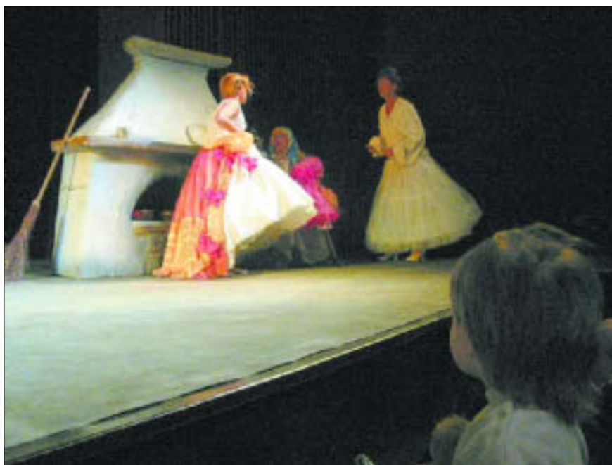
Teatr Dramatyczny – „Kopciuszek”

9.00 – 16.00 Miejski Ogród Zoologiczny. Kasa czynna do 15.00, ul. Norbertańska 2. Bilety: 5 zł, 3 zł, bilet zbiorowy (min. 10 osób) 2 zł; tel. 366 05 14