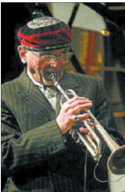
Płocki Ośrodek Kultury i Sztuki – Kawiarnia Jazzowa – koncert: Tomasz Stańko Quartet

18.00 Kawiarnia Jazzowa – koncert: Tomasz Stańko Quartet – promocja płyty, która ukaże się w lutym 2004 roku. Płocki Ośrodek Kultury i Sztuki ul. Tumska 9. Bilety: 20 zł; tel. 262 95 12 w. 30