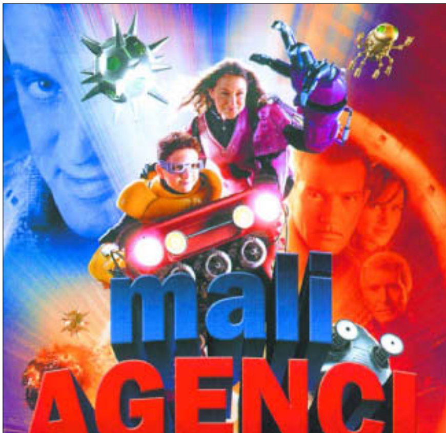
Centrum Kinowe Mazowsze – „Mali agenci 3D”

Centrum Kinowe Mazowsze; tel. 262-25-65; www.ck-mazowsze.plock.pl ; „Władca pierścieni: Powrót króla”, „Mali agenci 3D”