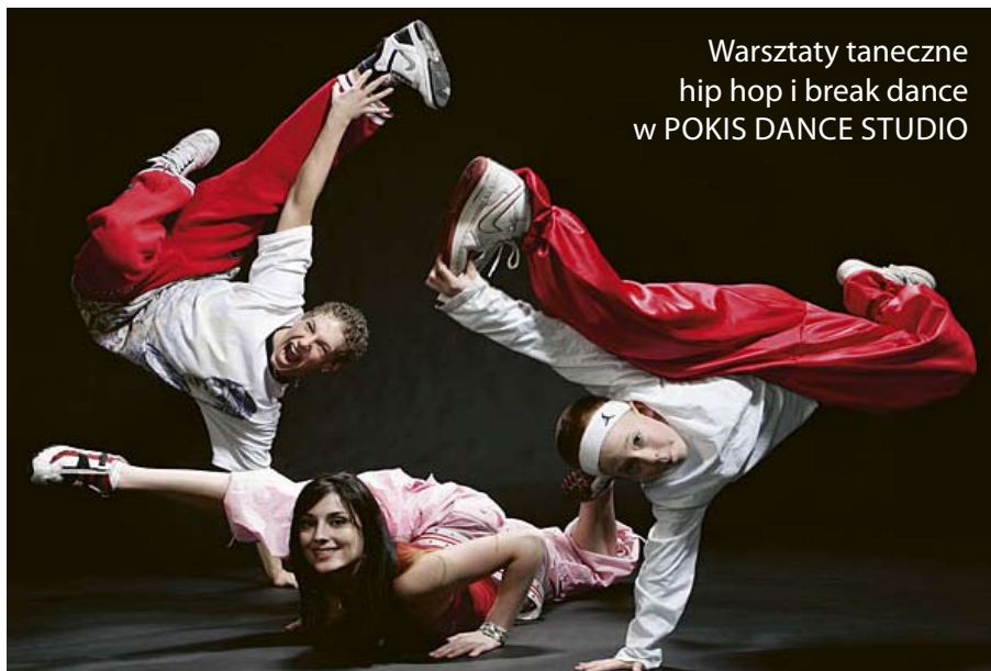
Warsztaty taneczne hip hop i break dance w POKiS DANCE STUDIO