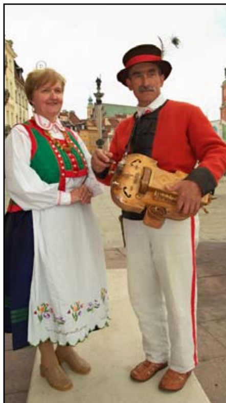
Wystawa „Kurpie Poland” w Spichlerzu do 20 lutego