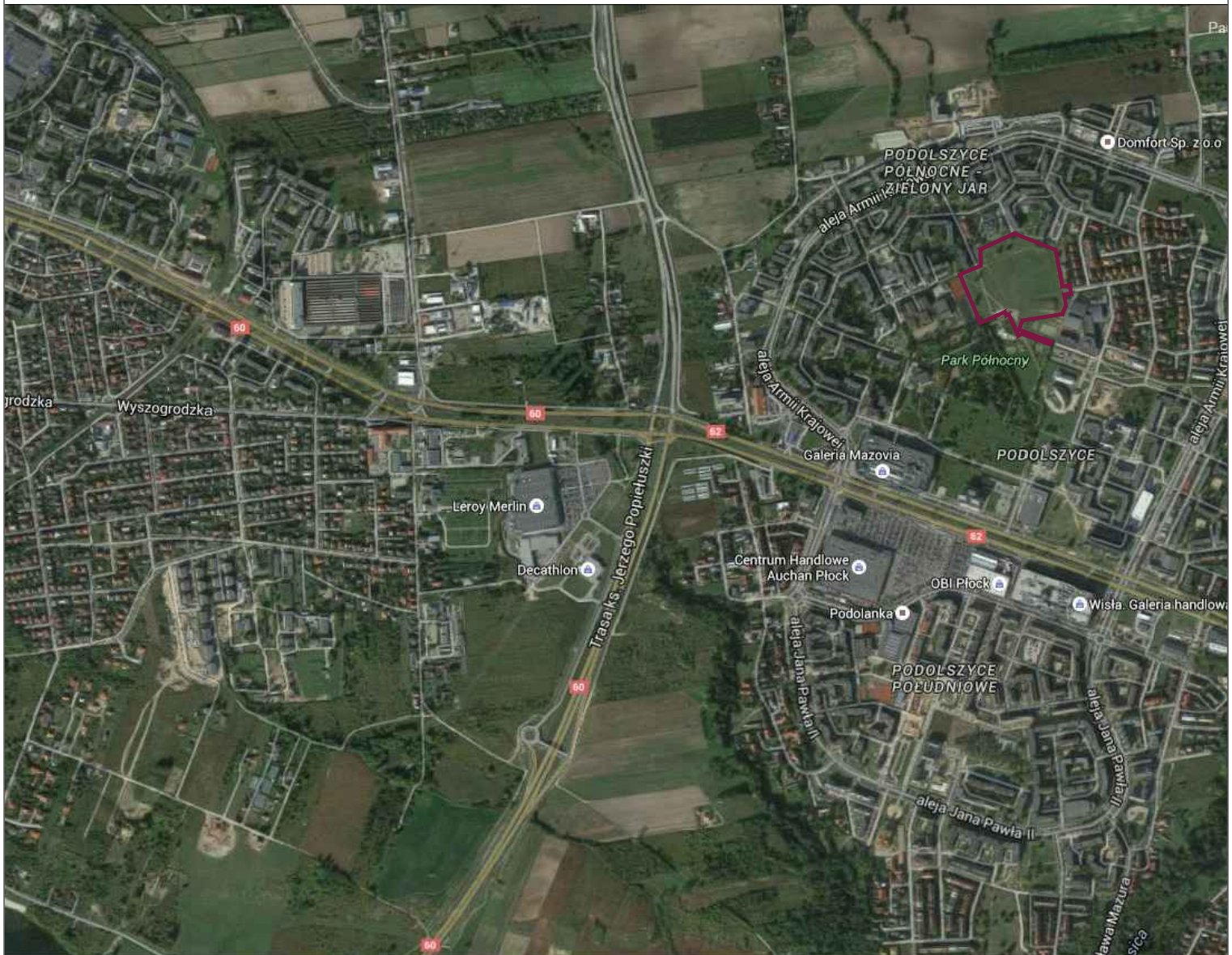
Rys. 1. Plan orientacyjny - lokalizacja