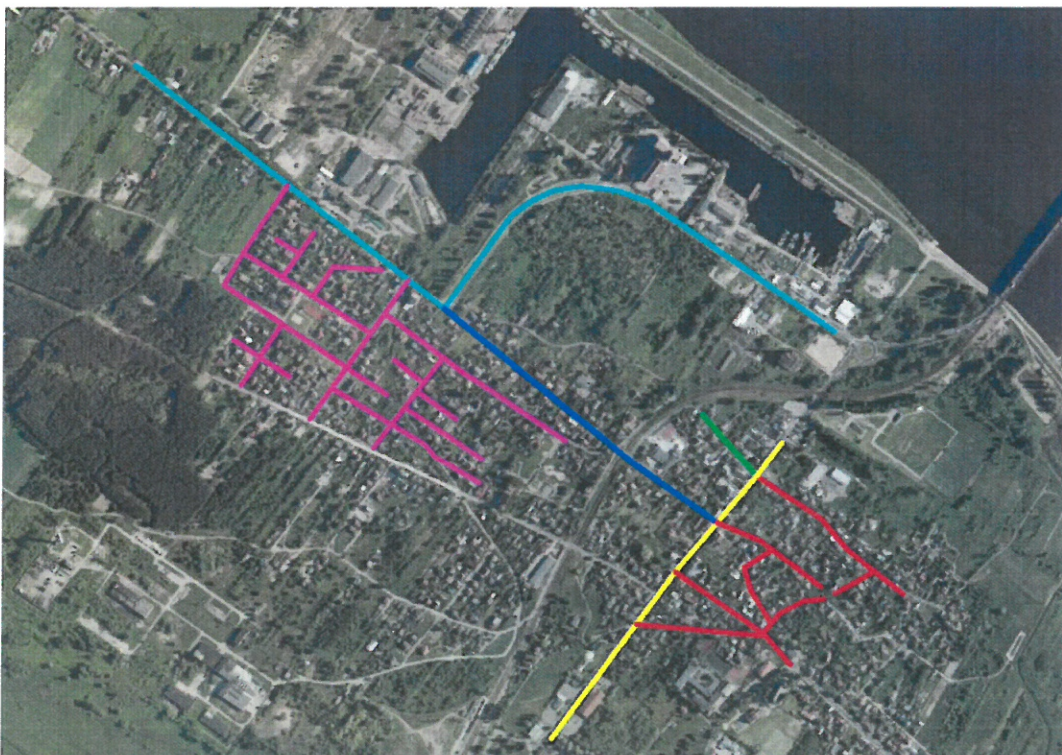
Rysunek 3 Planowana realizacja robót na terenie Osiedla Radziwie

W obszarze ulicy Dobrzykowskiej zakończenie prac budowlanych planowane jest w IV kwartale 2023 roku.