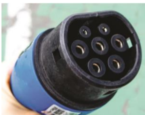
Rysunek 2 Graficzny zarys wtyczki typu 2 3

W ramach realizacji Planu budowy stacji ładowania pojazdów elektrycznych w Płocku zaplanowane do budowy stacje ładowania samochodów elektrycznych wyposażone będą w 2 punkty ładowania o mocy nominalnej 22kW tj. 2 gniazda lub gniazdo i kabel ze złączem (typ 2). Zainstalowane punkty ładowania będą mogły zasilać pojazdy elektryczne prądem przemiennym (AC).