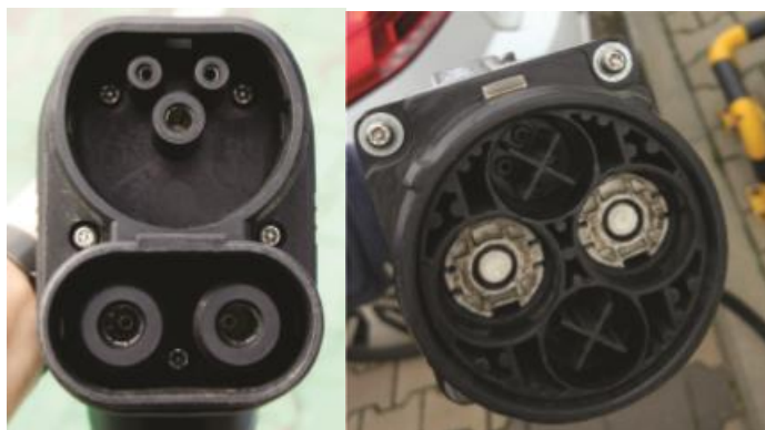
Rysunek 3 Graficzny zarys wtyczek: po lewej typ 2 COMBO (CCS) oraz po prawej typ CHADEMO 4

Graficzny zarys wtyczek typu CCS i CHADEMO przedstawiono na rysunku powyżej (Rysunek 3).